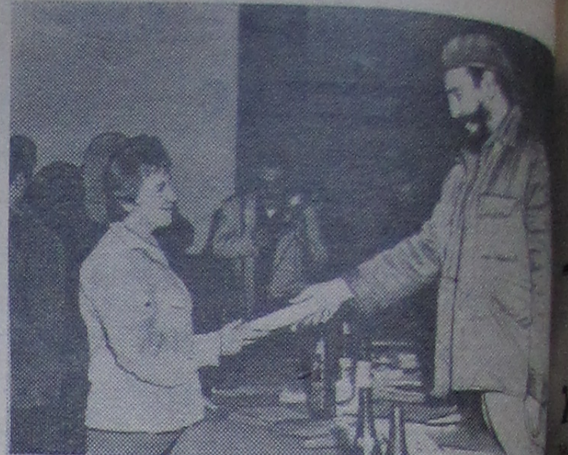
В Республике Куба этот год объявлен «годом образования». В горах Сиерра Маэстра на курсах проходит специальная подготовка кубинские юноши и девушки — добровольцы. Они получают звание учителей. Недавно состоялось торжественное вручение дипломов очередной группе учителей. На снимке: премьер-министр Фидель Кастро вручает дипломы учителям.