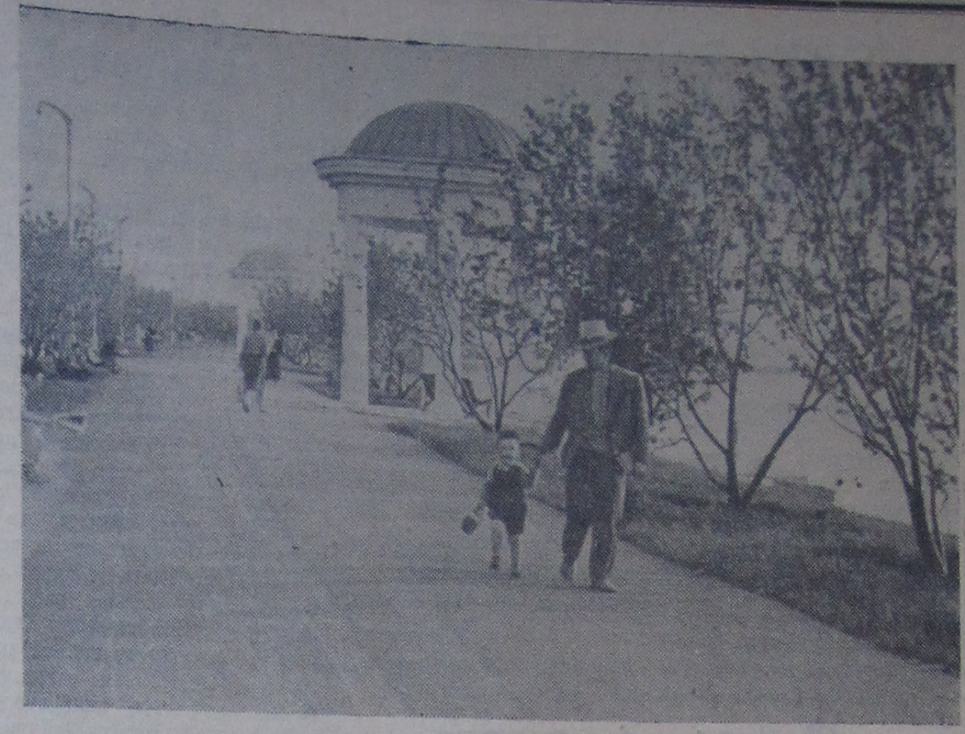
Хорошеет, преобразается наш город. Не так давно набережная Волги у Дома культуры ничем особенно не отличалась. Сейчас это — замечательное место отдыха. Вдоль реки протянулась яблоневая аллея, которую украсили белоснежные беседки. По вечерам и в выходные дни на набережной всегда многолюдно. На снимке: набережная Волги.

Хороший хозяин обустраивает одно место все оставшиеся материалы, но в МР-8 этого не было. Дефицитные строительные материалы засыпаются из Китая и изготавливаются на заводах в сотни километров от места их зарытия. Это удорожает себестоимость монтажных работ. Видимо, руководители сделали соответствующие выводы. Бесхозяйственность таит в конторе. В. Хрущев