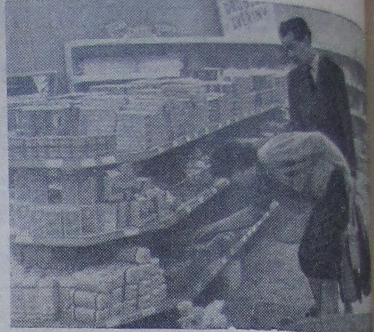
Магазины самообслуживания в Чехословакии.