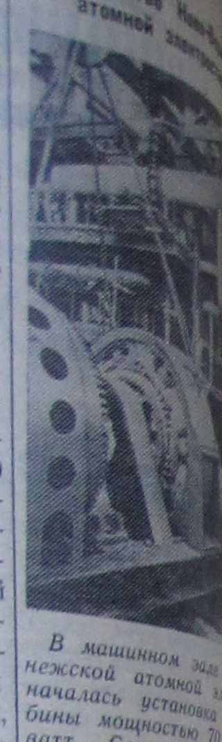
В машинном зале нежской атомной электростанции началась установка турбины мощностью 70 тысяч ватт. Соревнуясь в конкурсе на строительство атомной электростанции, записались досрочно собрать агрегаты.