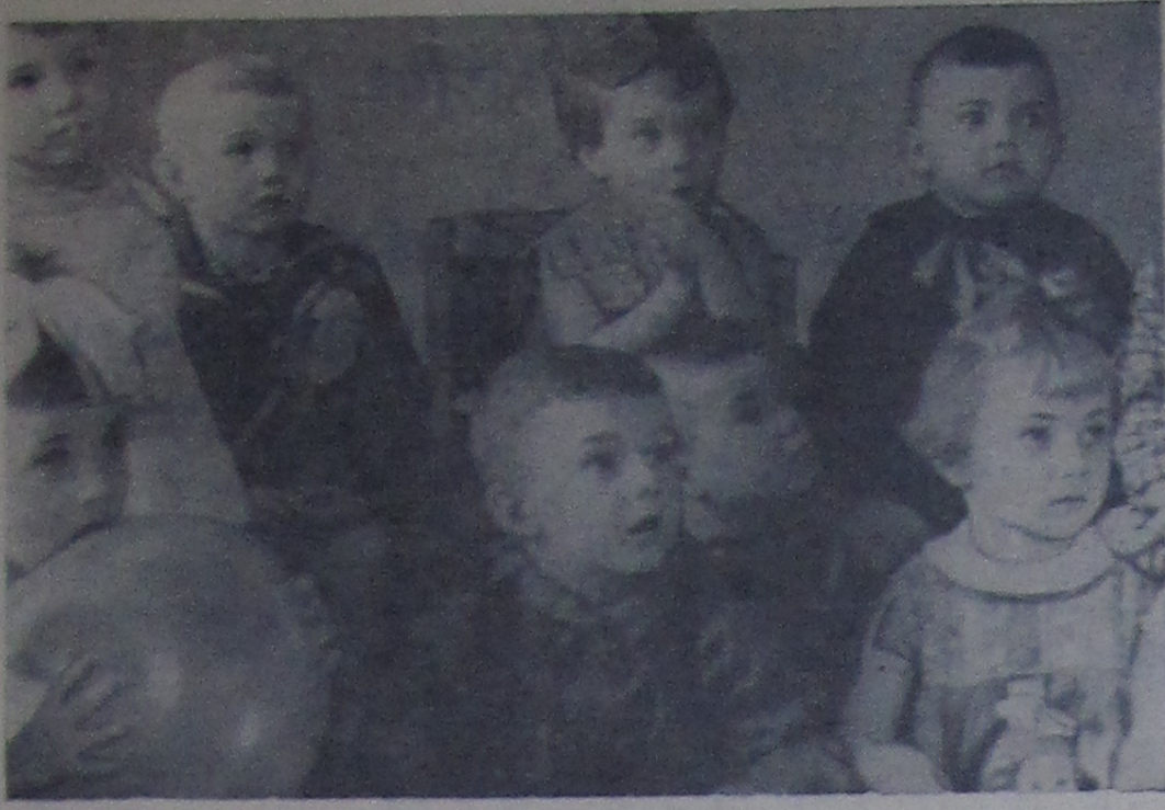
Посмотрите, с каким вниманием дети слушают интересную сказку, которую читает им воспитательница. Хорошо нашим ребятам в яслях! Здесь их вкусно кормят, внимательно следят за их здоровьем, прививают много полезных навыков. В яслях ребенок узнает много интересного. На снимке: ребята из 4-х детских яслей.