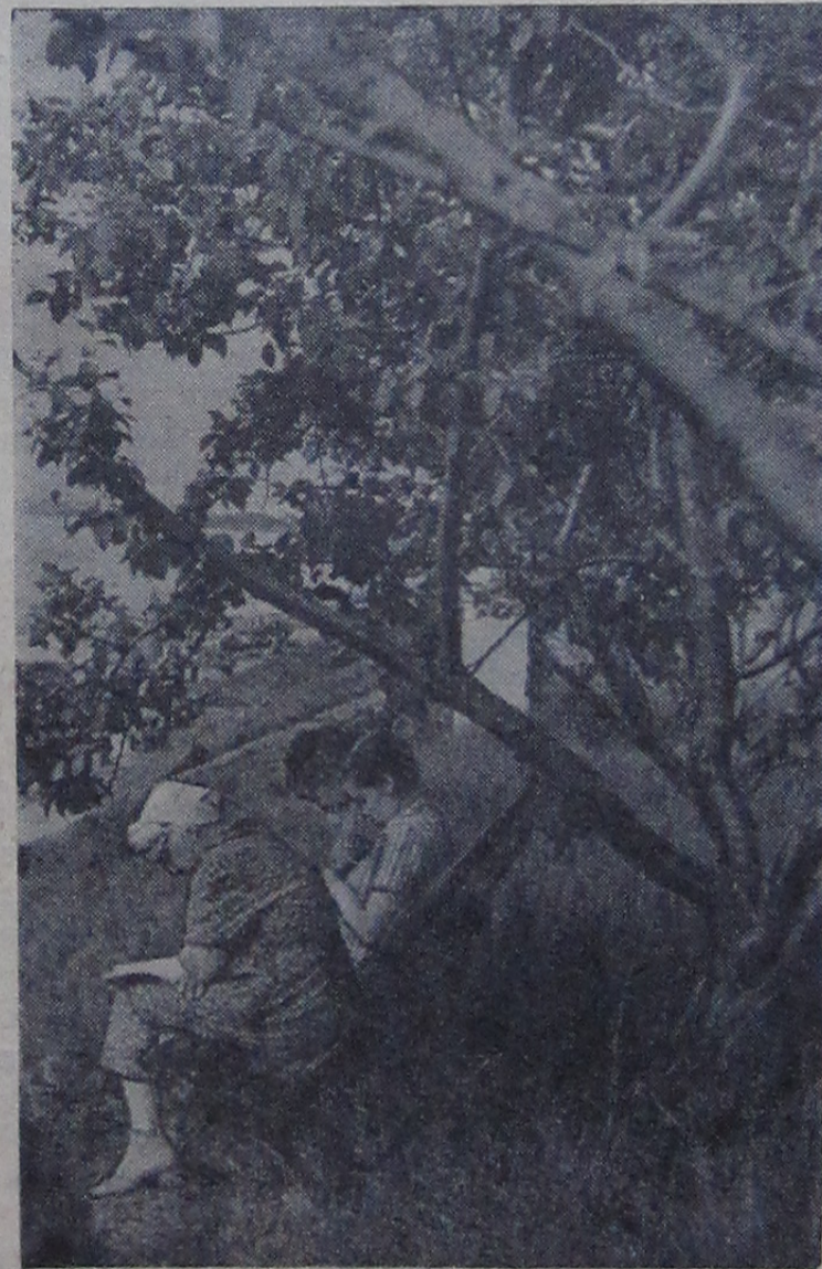
Лучи заходящего солнца тепло ложатся на берег, тихий ветерок играет листвою яблонь на набережной. Вдали, как белоснежные лебеди, скользят по воде яхты. Хорошо у нас на Волге.

Первая программа 10.45 — «На морских рубежах Отчизны». Передача из Москвы и Ленинграда. 16.15 — Для школьников. «Бери с коммунистов пример». 16.30 — Для детей младшего и школьного возраста. В. Гауф — «Карлик-нос». Премьера телевизионного спектакля. 17.55 — Телевизионные новости. 18.10 — «Сегодня на форуме». 18.25 — Для воинов Советской Армии и Флота. Концерт ансамбля песни и пляски Краснознаменного Балтийского флота. Передача из Ленинграда. 19.55 — Спортивная передача. 20.45 — Художественный фильм. 22.15 — Телевизионные новости.