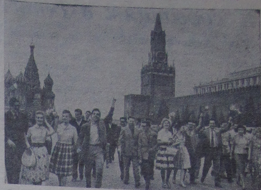
Группа молодежи из стран Латинской Америки с москвичами на Красной площади.