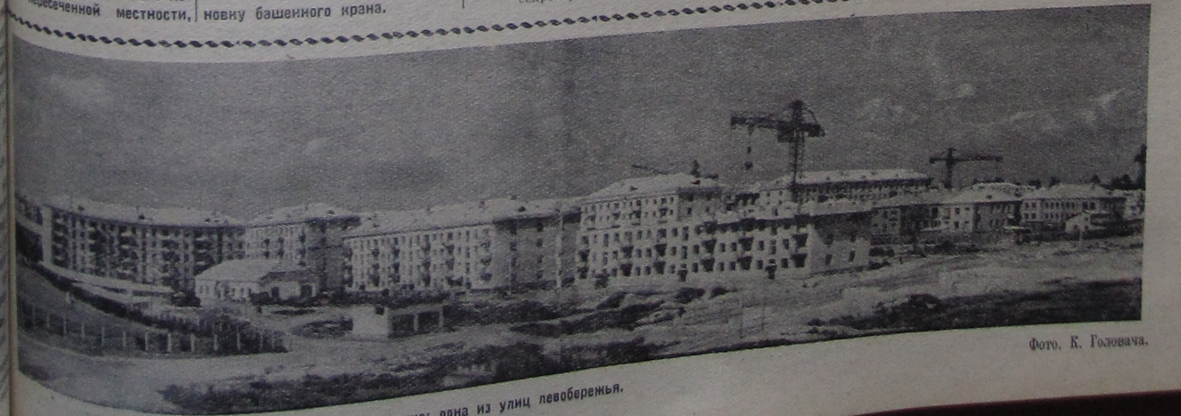
Дубна строится. На снимке: одна из улиц левобережья.