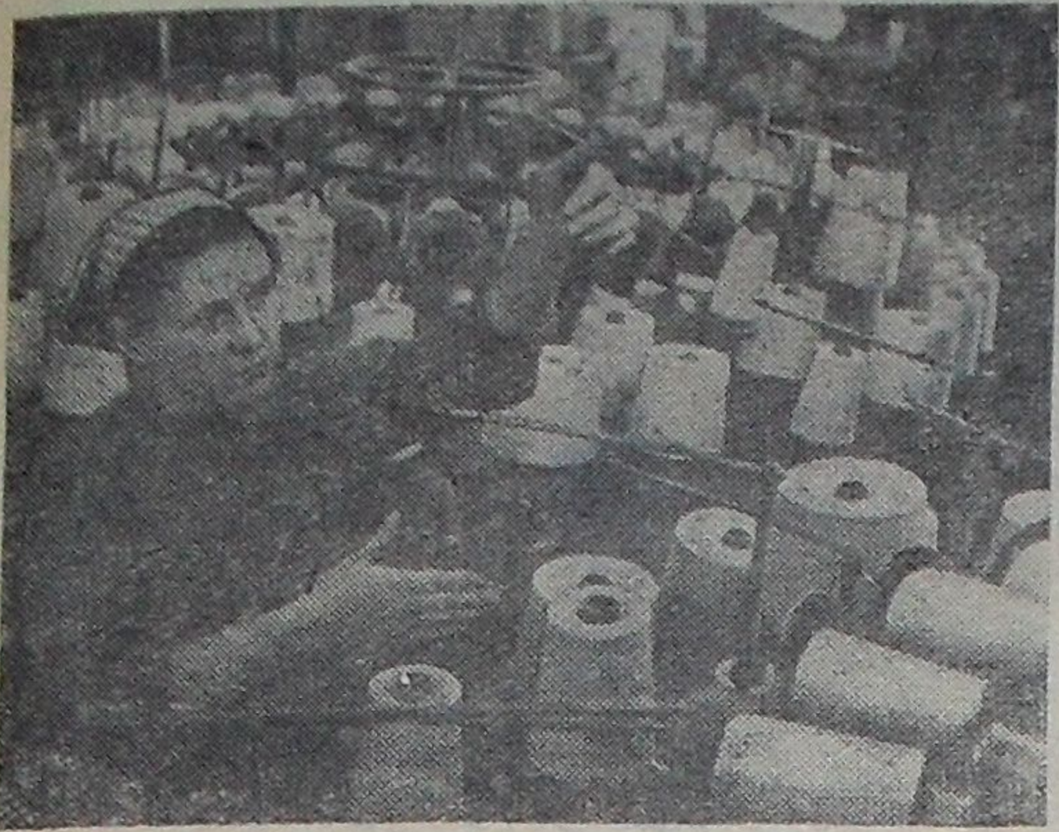
«Советское — значит отличное» — под таким девизом трудится коллектив рижской трикотажной фабрики «Саркана Балтия». В нынешнем году предприятие не получило ни одной претензии к качеству продукции. Производительность труда возросла на 8,5 процента по сравнению с прошлым годом. Фабрике присвоено звание предприятия отличного качества и высокой производительности.