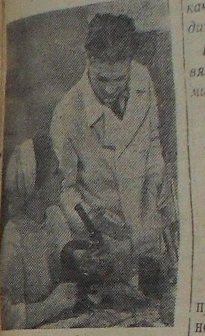
35 тонн кормового биомицилина и тетрациклина выработал завод этого года специальный цех, оборудованный в заводском имену Кирова Красносельского района Красносельского края. Один килограмм ценного препарата обходится колхозу всего 11 копеек — значительно дешевле, чем импортные антибиотики.

Кормовой биомицилин и тетрациклин находят широкое применение в колхозном животноводстве, являются хорошим профилактическим средством, предупреждающим заболевания поросят, телят, цыплят, ускоряют рост молодняка.