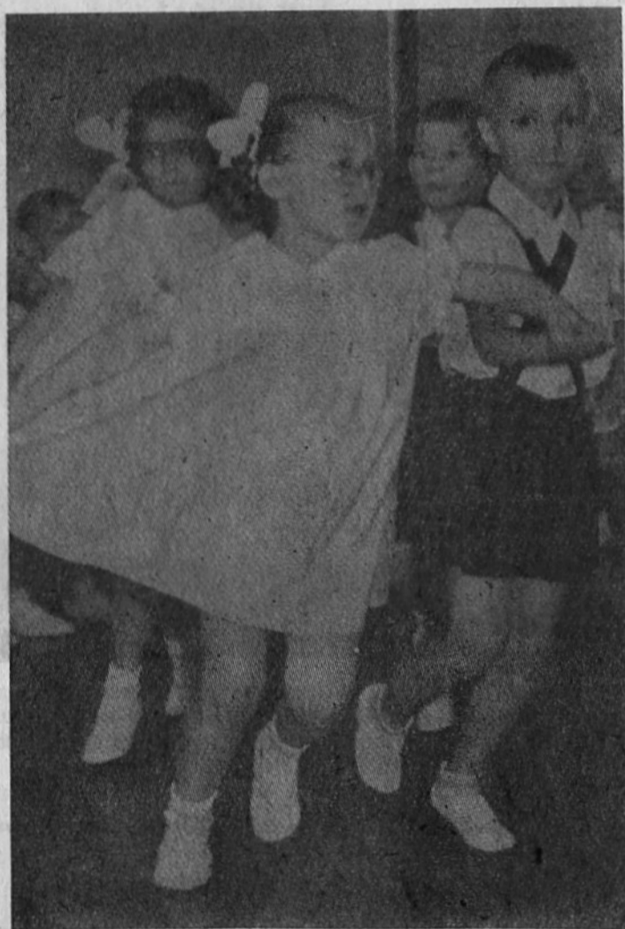
Весело прошел утренник в детском саду № 8 (институтская часть города), посвященный проводам в школу.