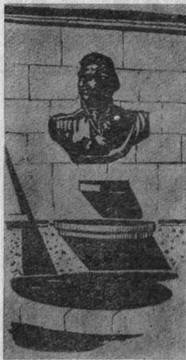
Идущий по глухим горным дорогам к Анчарскому перевалу.