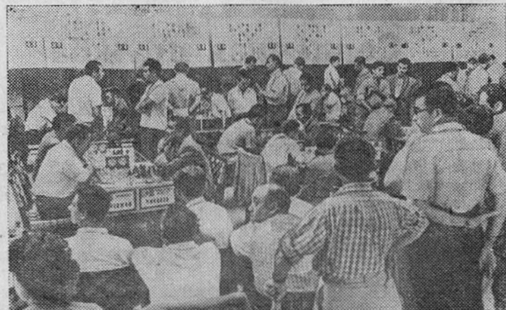
В болгарском городе Варна проводится XV шахматная олимпиада. Здесь собрались сильнейшие шахматисты мира.

СУДОХОДНАЯ ИНСПЕКЦИЯ МОСКОВСКОГО БАССЕЙНА.