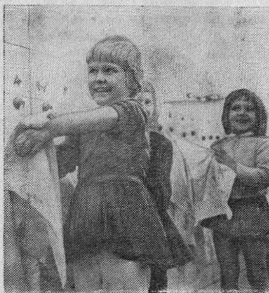
На снимке: в интернате села Чиста. Надо вымыть руки перед завтраком.

Члены сельскохозяйственно-го кооператива села Чиста (Центральная Богемия, Чехословацкая Социалистическая Республика) собственными силами построили для своих детей интернат на 31 место. В стране имеется около 7.000 интернатов, в которых воспитывается более 300.000 детей в возрасте от 3 до 6 лет.