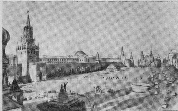
Москва сегодня. Красная площадь.