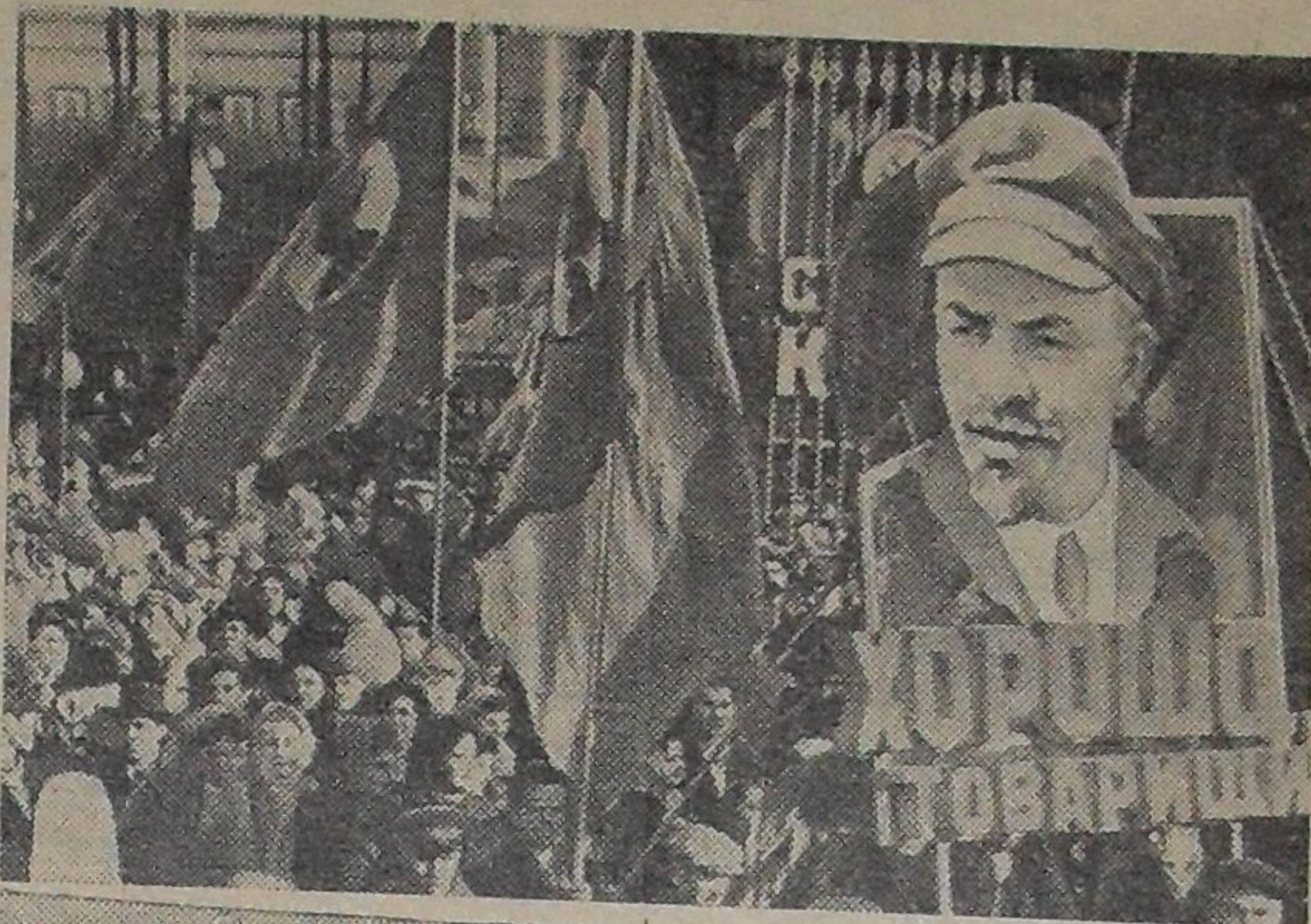
Демонстрация представителей трудящихся.