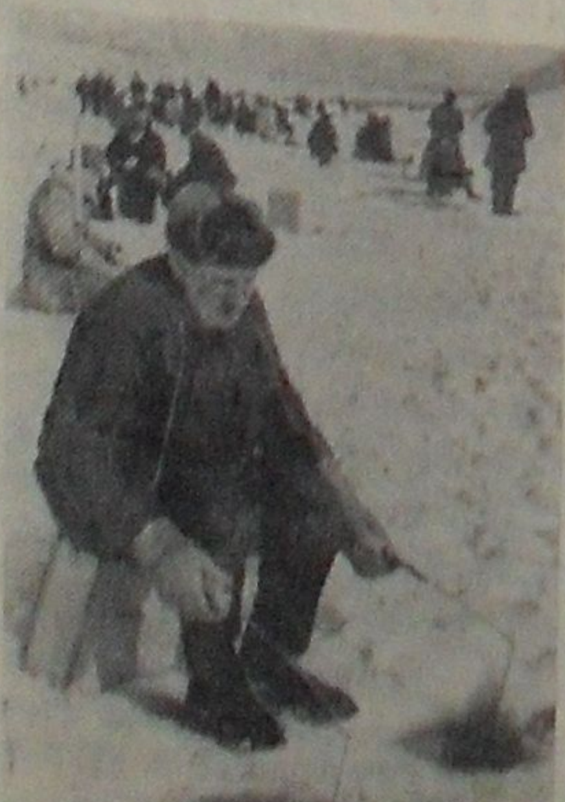
На рыбалке.

С докладом о значении утренней гимнастики выступила перед собравшимися воспитательница старшей группы Н. С. Кудрявцева.