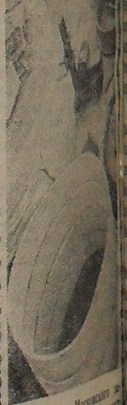
Коллектив Московского завода железобетонных изделий № 29 освоил производство круглобортных железобетонных труб с диаметром до 1,2 метра и длиной до 12 метров. Трубы могут использоваться для строительства водопроводов, канализации, дренажных систем, а также для строительства мостов, путепроводов, тоннелей и т. д.