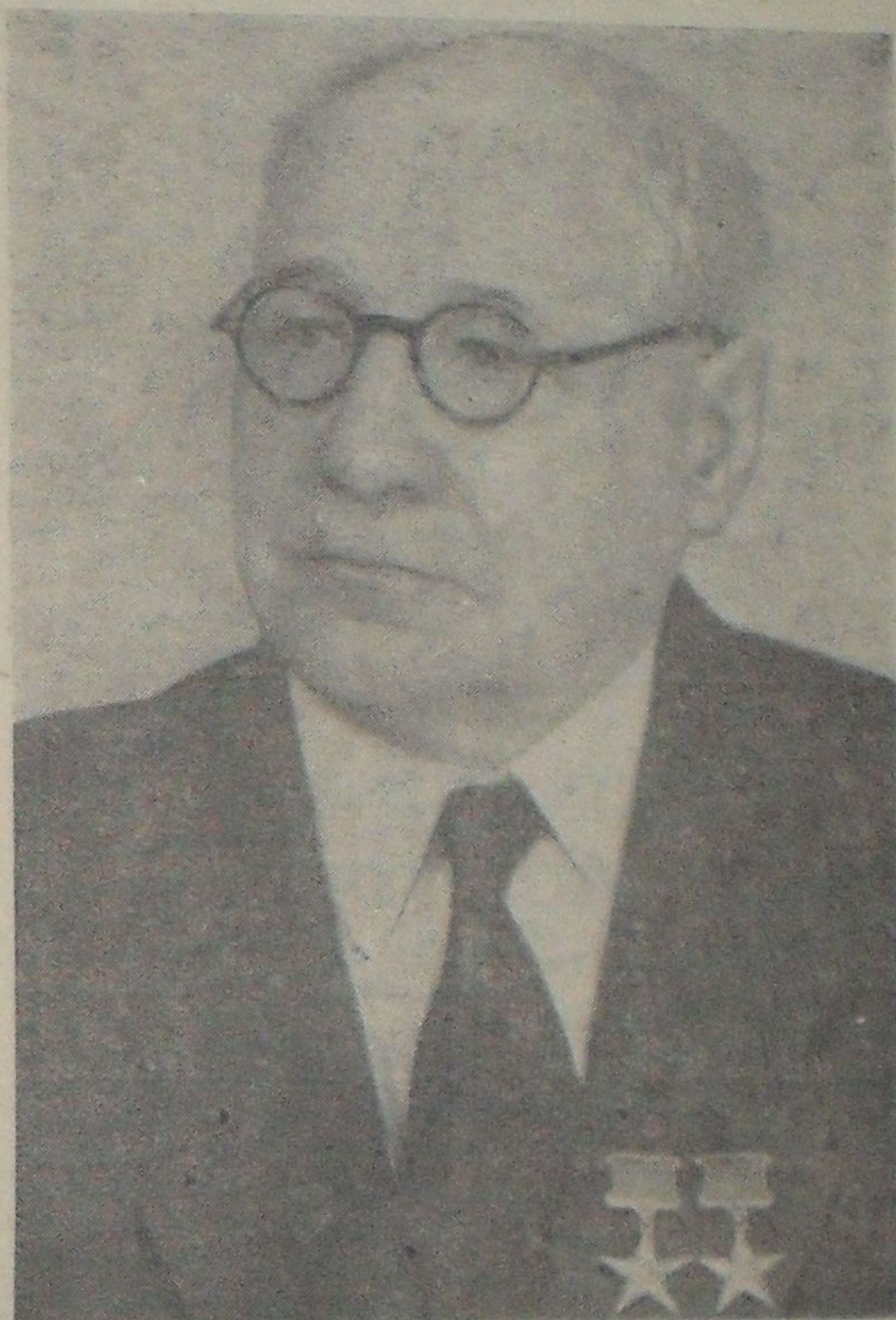
Андрей Николаевич ТУПОЛЕВ Московский сельский избирательный округ № 2 по выборам в Совет Национальностей