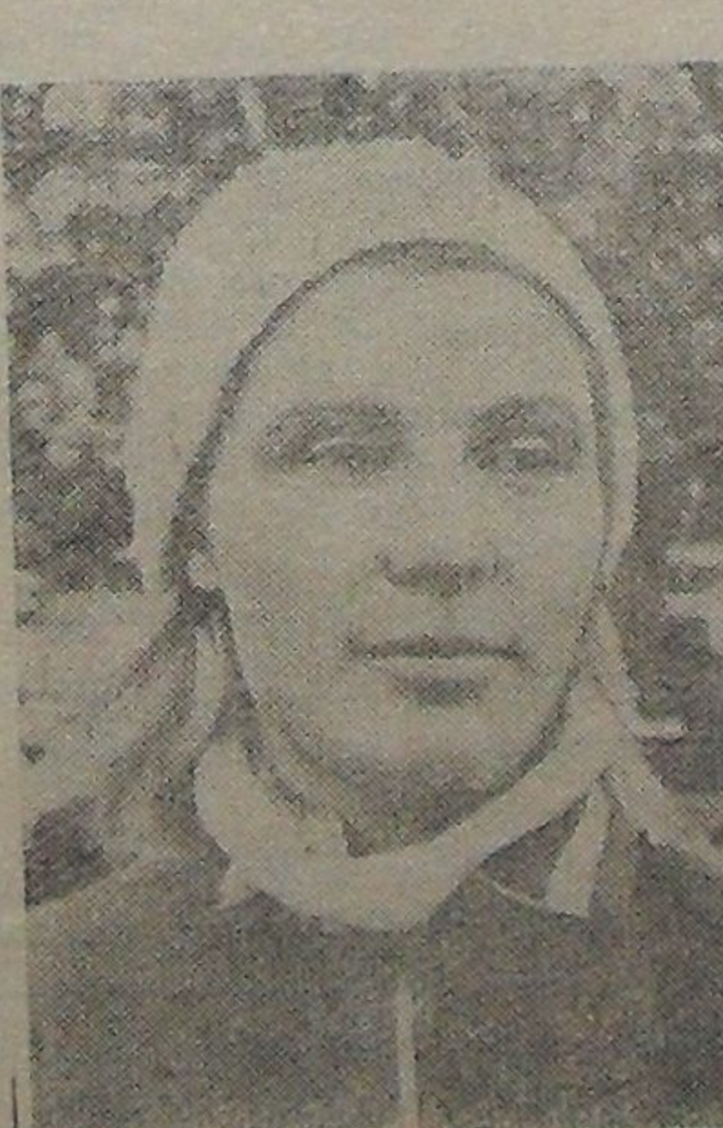
Инга Воронина — чемпионка мира 1962 года по скоростному бегу на коньках.