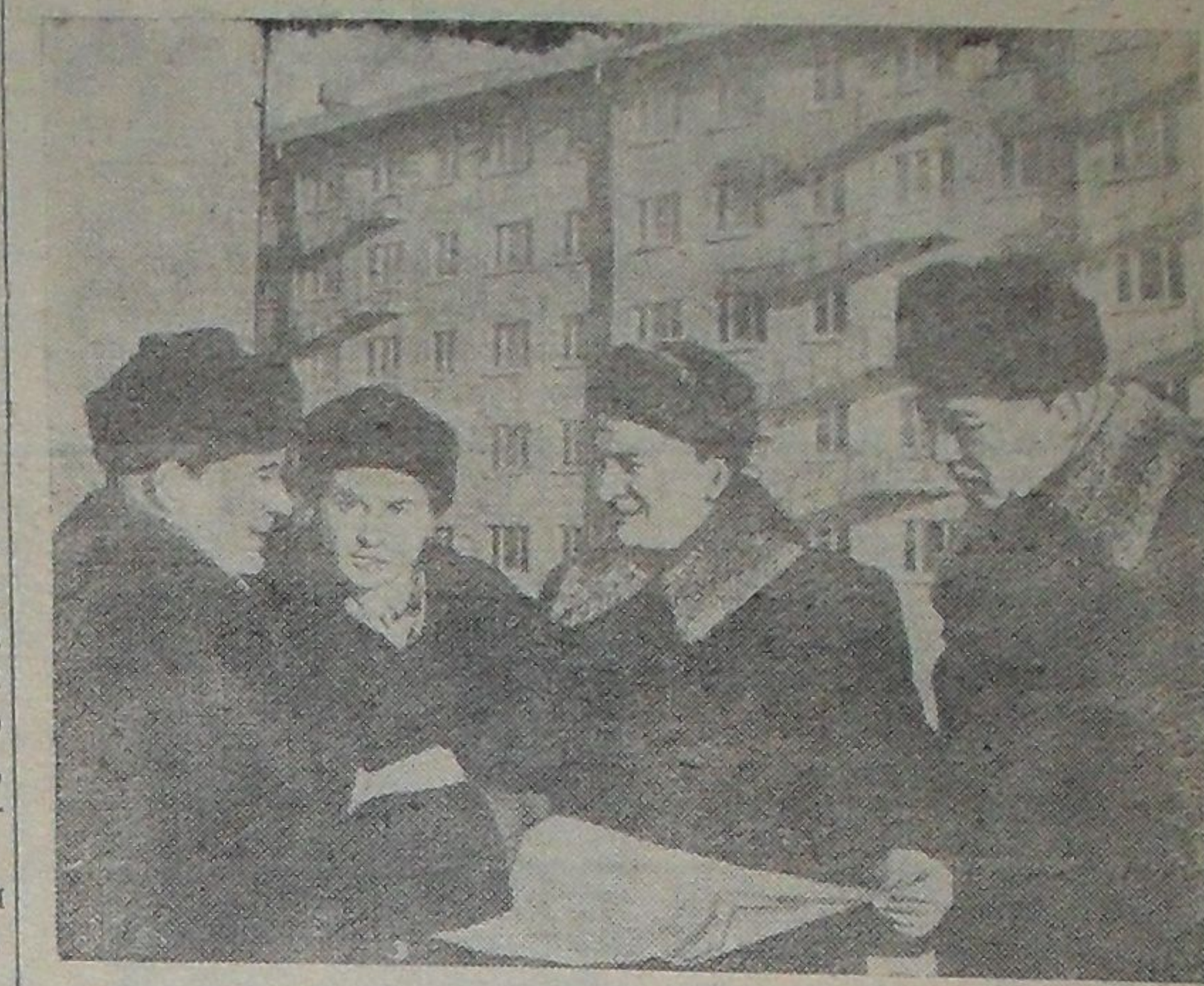
СВЕРДЛОВСК. Группа инженеров совнархоза разработала новый метод жилищного и промышленного строительства.

Они создали автоклавы диаметром 3,6 метра для изготовления пенобетонных панелей, а также разработали и освоили новую технологию производства бесцементных крупнопанельных домов. В Свердловском совнархозе налажено производство крупноразмерных изделий из ячеистых бетонов. Это обеспечивает строительство более одного миллиона квадратных метров жилых домов и одного миллиона квадратных метров промышленных зданий в год. В них будут