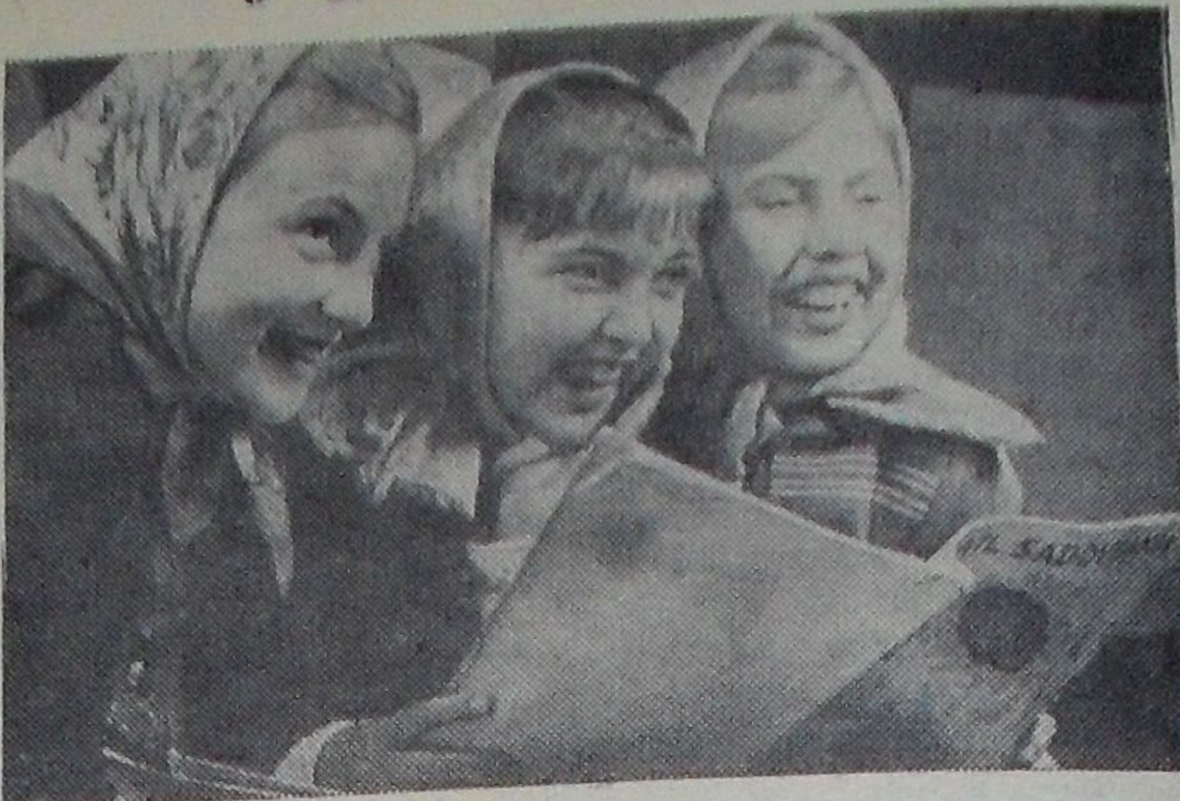
Неустанной заботой и вниманием окружено подрастающее поколение в Румынской Народной Республике. Все дети школьного возраста учатся. Для развития их творческих способностей в стране открыто свыше ста домов и дворцов пионеров, кукольные театры, создаются фильмы, известные писатели пишут для детей книги.