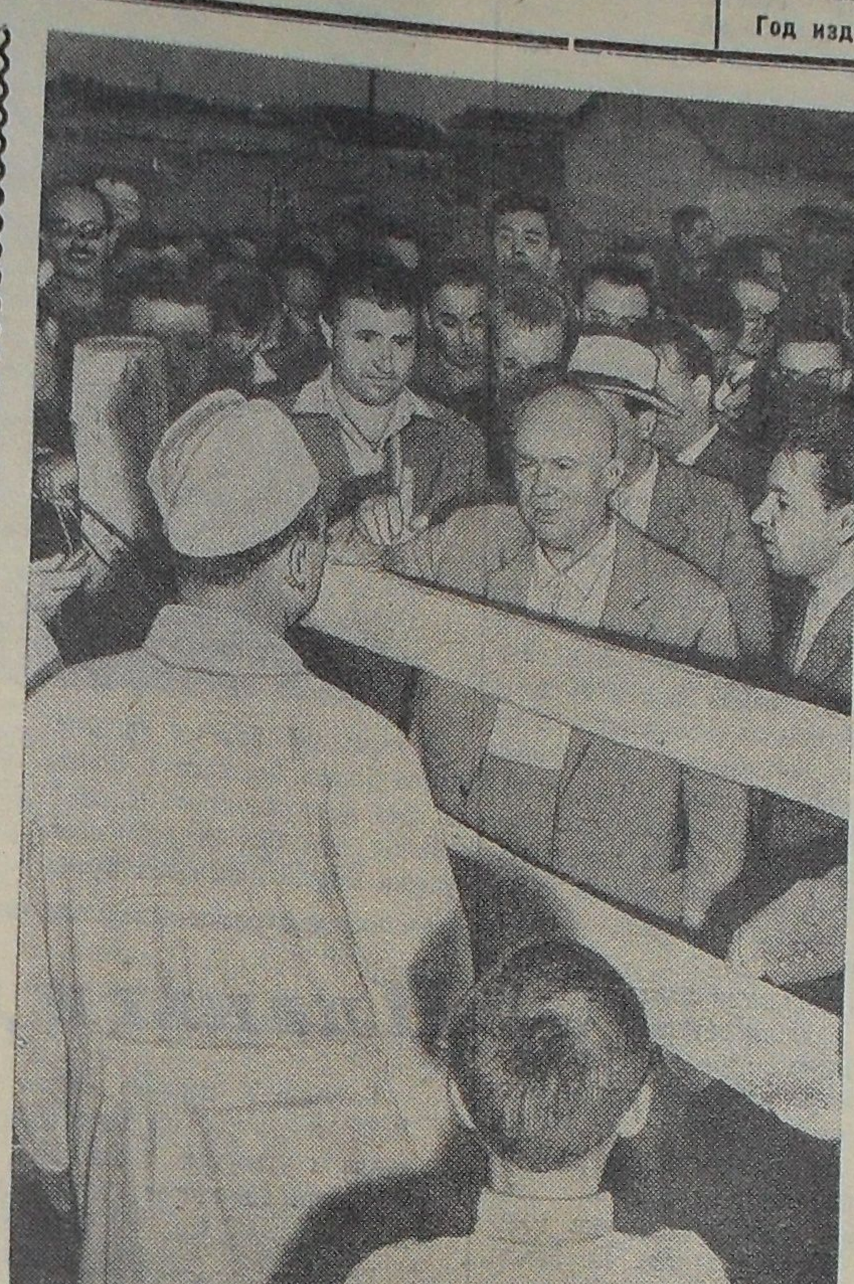
Пребывание советской партийно-правительственной делегации во главе с товарищем Н. С. Хрущевым в Румынской Народной Республике.

Единодушное присуждение Большой премии фестиваля — Кристалльного глобуса советскому художественному фильму «Девяти дней одного года» явилось закономерным итогом праздника кино в Карловых Варах.