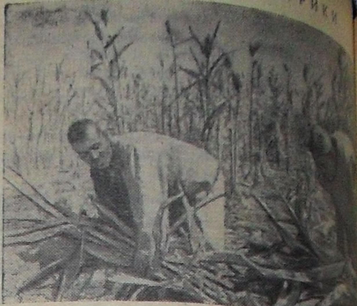
РЕСПУБЛИКА ЧАД. Сорго — одна из ведущих культур в стране. На снимке: уборка сорго.

Адрес редакции: гор. Дубна, Советская, 11. Телефоны: редактор — Институт 2-81, общий — городской АТС 75-23 и 74-73. Дни выхода газеты — вторник и четверг.