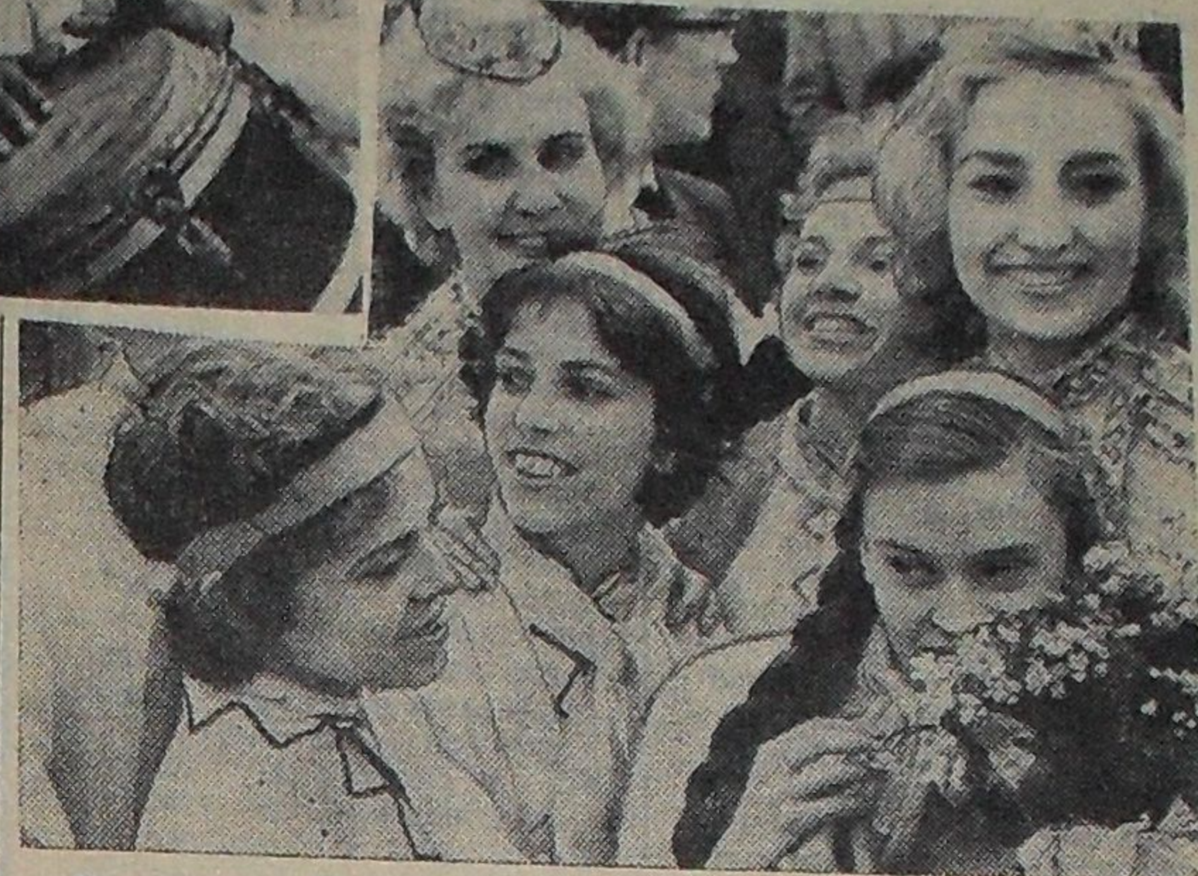
На снимке: «Мир и дружба!» — написано на лицах жизнерадостной советской молодежи.

В справочнике приведены необходимые данные об оплате труда рабочих, руководящих, инженерно-технических работников и служащих в строительстве и на производственных предприятиях, входящих в состав строительных организаций, а также изложены вопросы трудового законодательства. В справочнике даются основы организации и нормирования труда. М. ПЕВЗNER, зав. читальным залом.