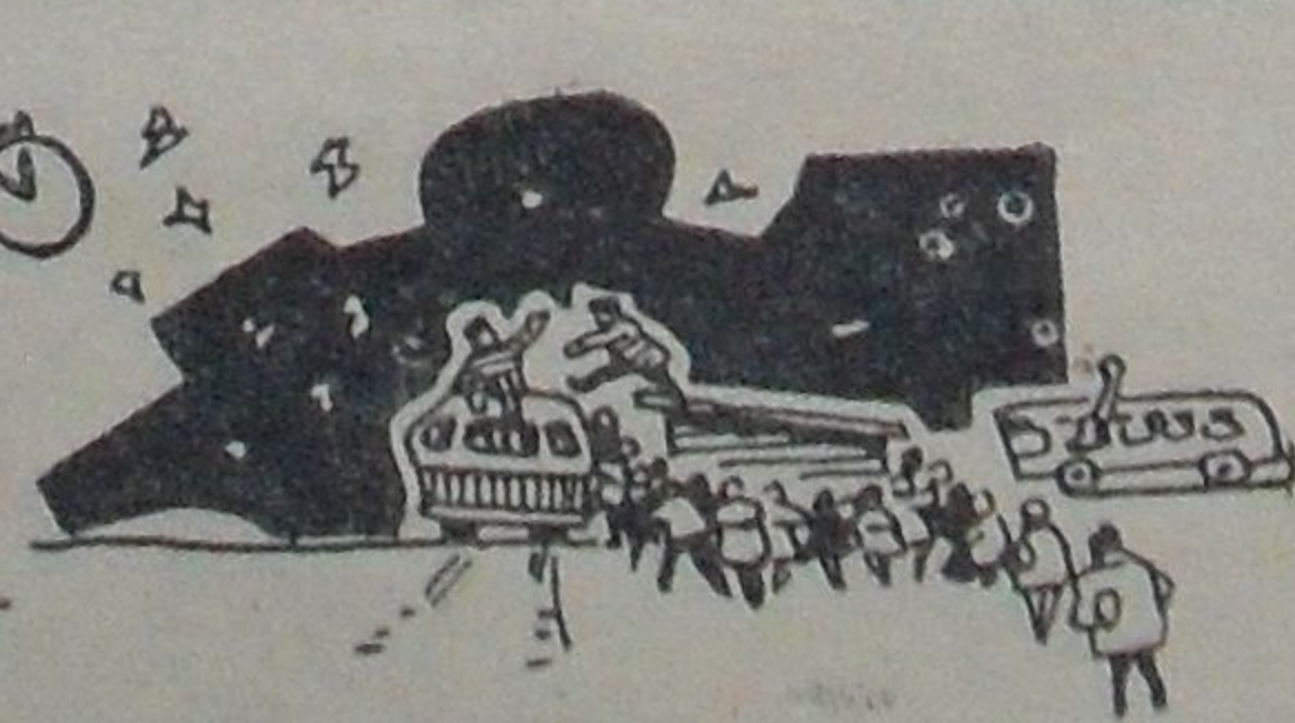
В ЧАСЫ ПИИ.