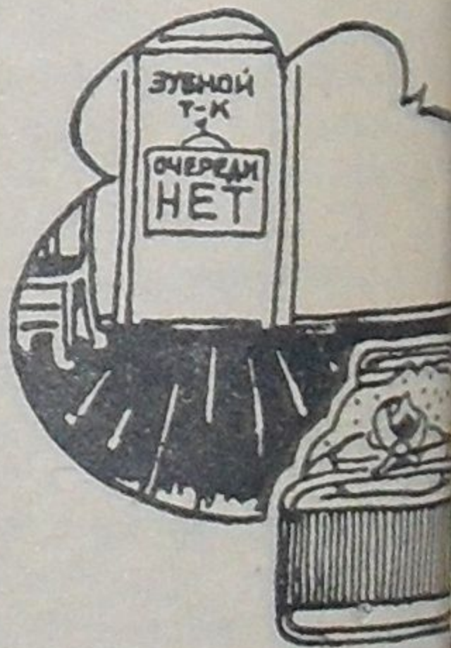
Пока только слышно.