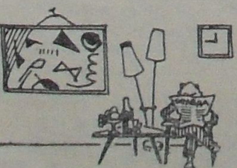
И это есть «картина».