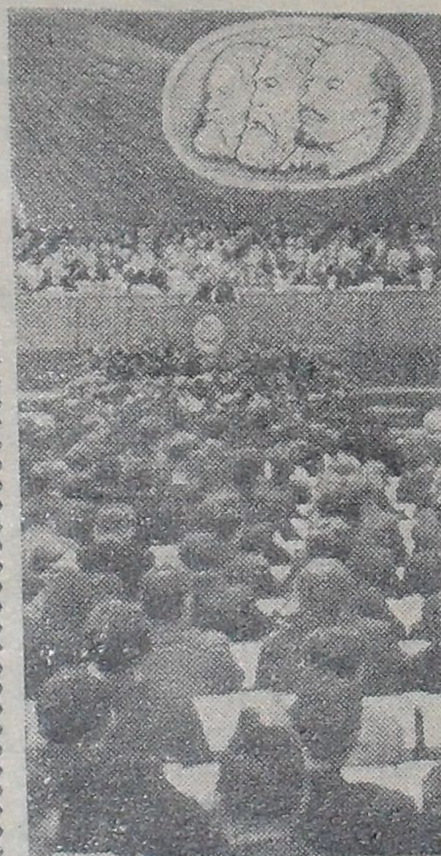
БЕРЛИН. VI съезд Социалистической единой партии Германии.

Утвердить городскую избирательную комиссию по выборам в Дубненский городской Совет депутатов трудящихся в составе следующих представителей общественных организаций и обществ трудящихся: