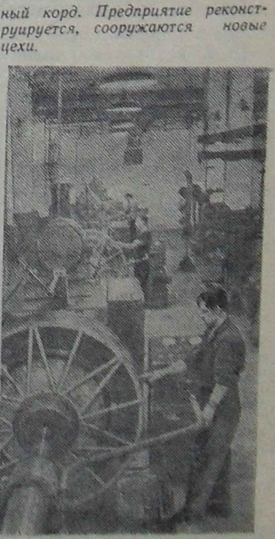
На снимке: новый участок сборки покрышек типа «Р» для тракторов «Беларусь».