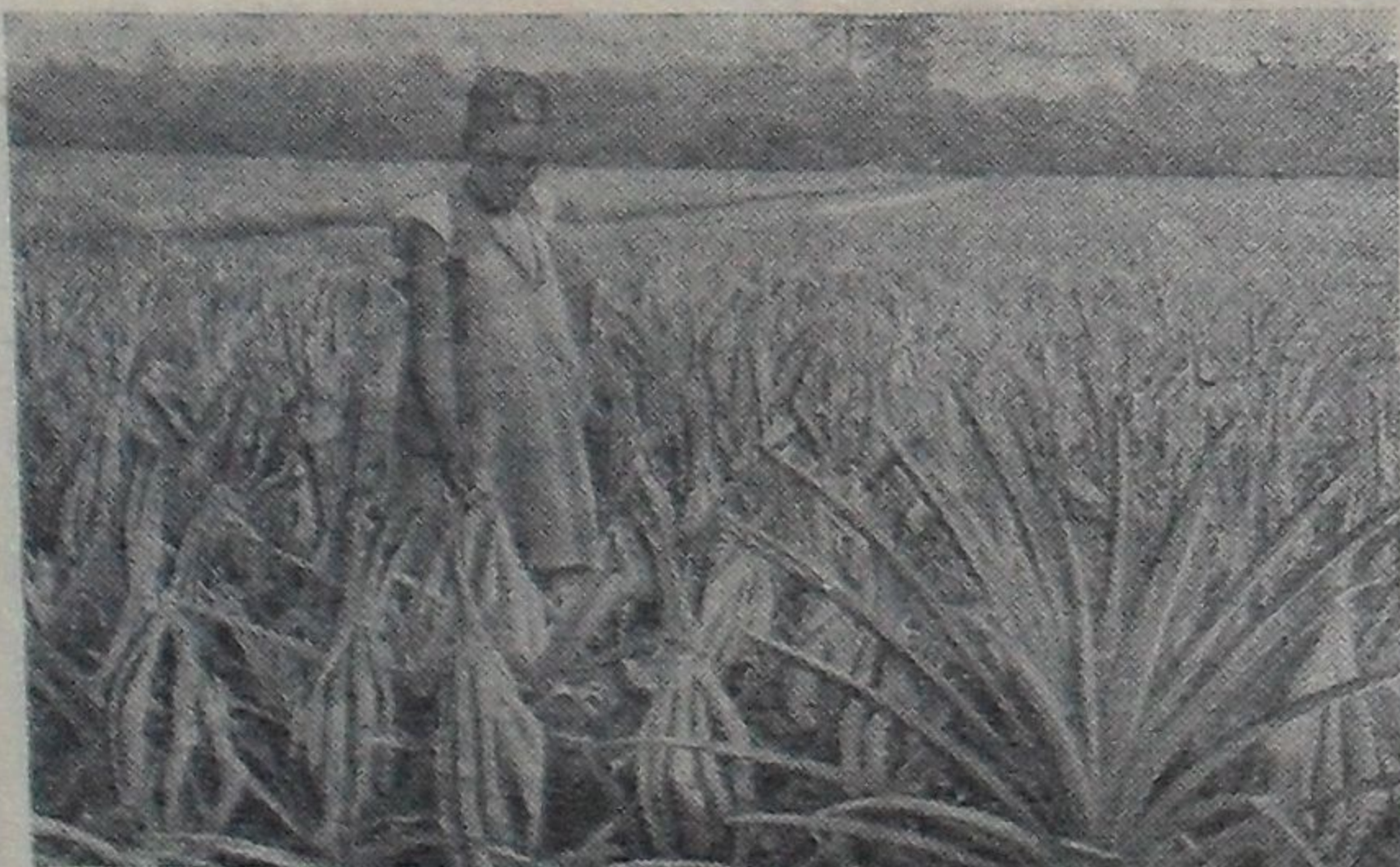
ГВИНЕЙСКАЯ РЕСПУБЛИКА. Ананасы начали выращивать в стране совсем недавно. Большая часть плодов идет на экспорт в свежем или консервированном виде. В ближайшем будущем ананасовые плантации будут значительно расширены. На снимке: ананасовая плантация.