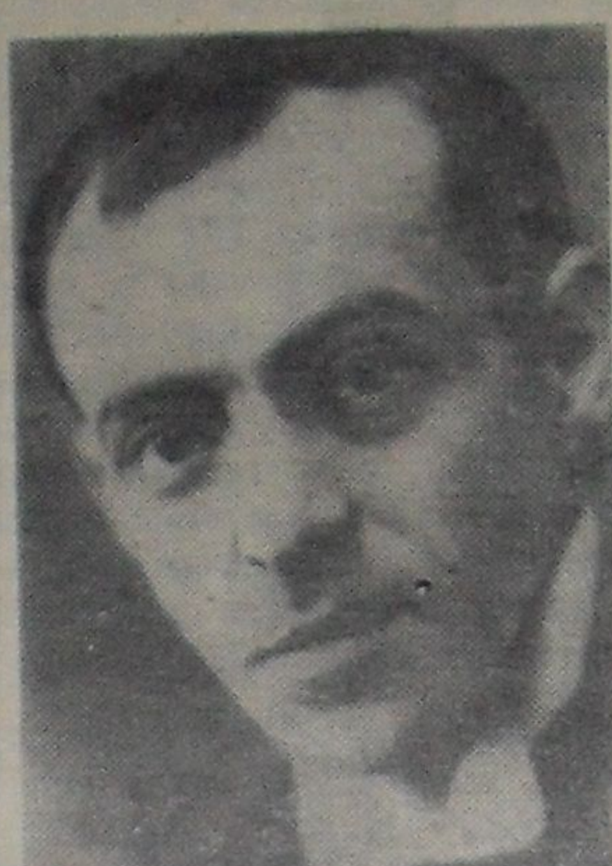
Вахтангов Евгений Багратионович (1883—1922 гг.) — выдающийся русский режиссер, актер и театральный деятель. Он был одним из первых учеников К. С. Станиславского, который его высоко ценил. С 1911 года преподавал систему Станиславского в многочисленных школах и студиях Москвы. С образованием Первой студии МХТ (1912 г.) вошел

в нее как актер и режиссер. Вахтангов отличался глубокой характерностью, проницательностью.