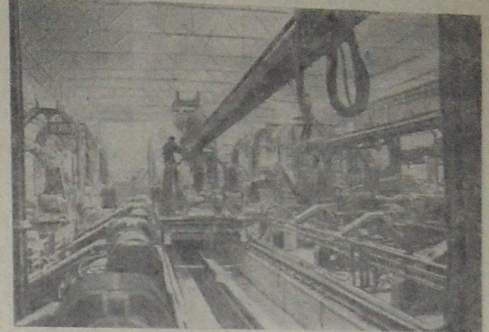
В Челябинске на трубопрокатном заводе возводится новый трубосварочный стан. Ближайшее время, когда он сможет выпускать для нефте- и газопроводов трубы диаметром 1020 миллиметров. Идет наладка оборудования на первой сварочной линии. На снимке: монтаж агрегатов.