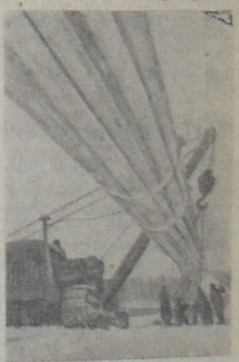
ТАТАРСКАЯ АССР. В пятом году семилетки войдет в строй первая очередь одного из крупнейших предприятий химической промышленности страны — Казанского завода органического синтеза. Сырьем для нового предприятия послужит попутный газ нефтяных месторождений Татарии. От нефтяного центра республикан Миннибаев до Казани прокладывается специальный газопровод. Сейчас на трассе напряженные дни. Укладывается трубосварочный стан. В суровых условиях зимы упорно трудятся коллективы отряда подводно-технических работ. На снимке: подготовка дюзера к укладке на дно реки.