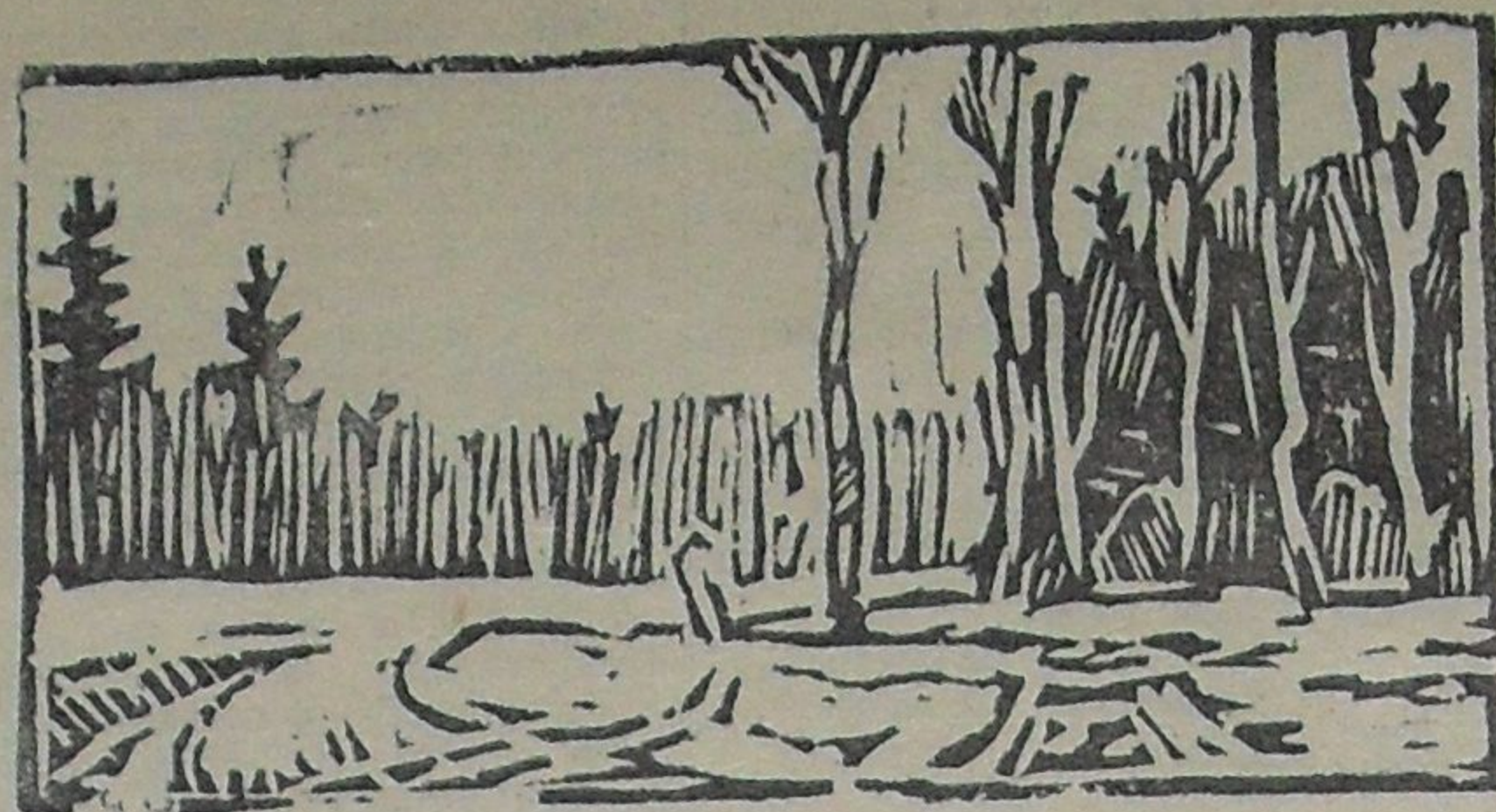
Апрель в лесу.