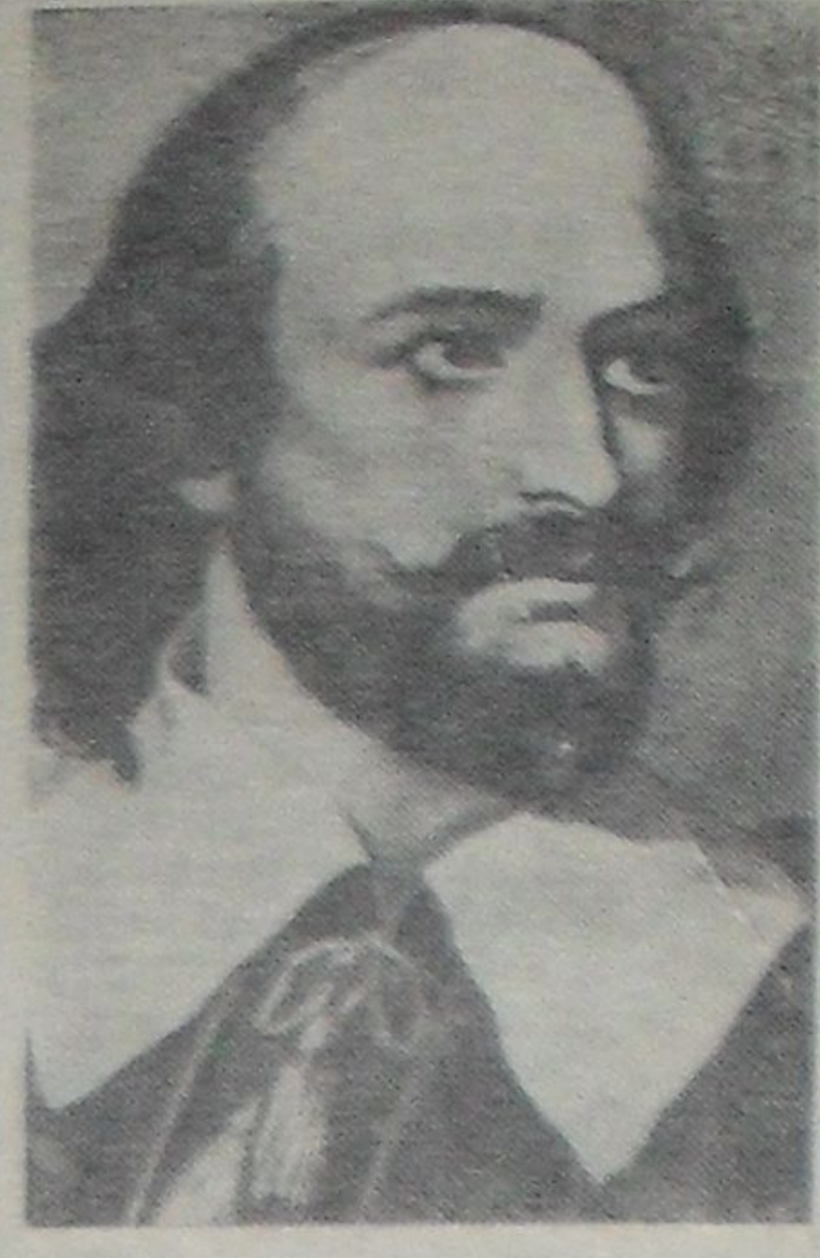
Вильям Шекспир — великий английский поэт и драматург (1564 — 1616 гг.).

Завтра исполняется 400 лет со дня рождения Вильяма Шекспира