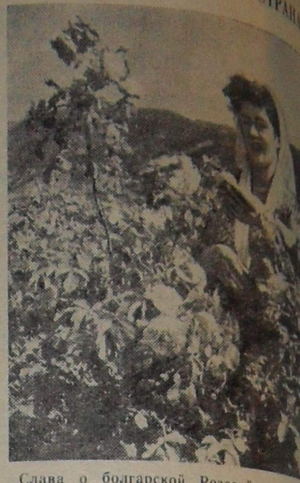
Слава о болгарской Розовой долине пересекла границы Болгарии. Здесь растет ценная эфиромасличная роза «Дамасцена» как ее называют в Болгарии Красная роза. Ее цвет держат самый высокий процент розового сырья для парфюмерной промышленности.

общий — 75-23. Дни выхода газеты — среда и суббота.