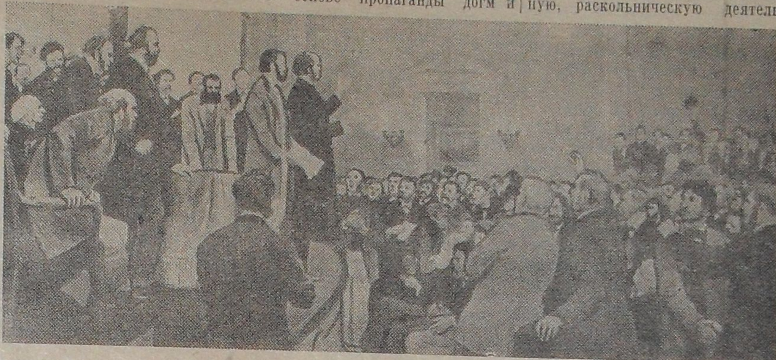
Основание Первого Интернационала. Митинг 28 сентября 1864 года. В Сент-Мартинс-Холле. (Лондон).

Вся история международного рабочего движения показывает, что неизбежно обречены на провал попытки подменить знамя живого и развивающегося революционного марксизма мертвыми догмами. Совершенно бесперспективными оказывались попытки сплотить действительное рабочее движение разных стран на основе пропаганды догм и