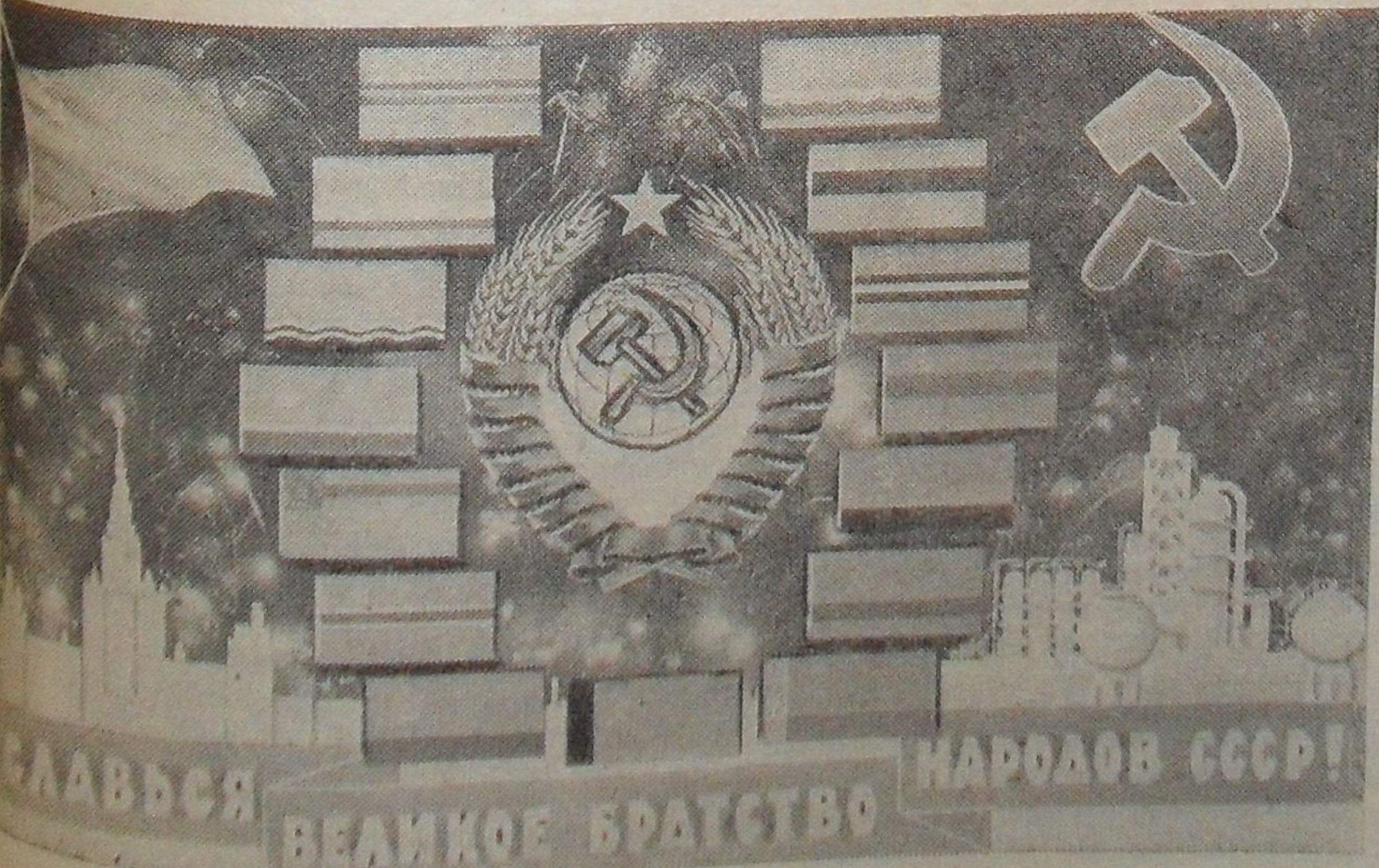
Плакаты художника М. Ишмаметова (издательство «Советский художник»)

Письмо в редакцию Разрешите через редакцию передать сердечное приветствие всем организаторам, членам, активистам организации пионерского музея в г. Дубна. Семья Муминова Редактор А. М. Петров