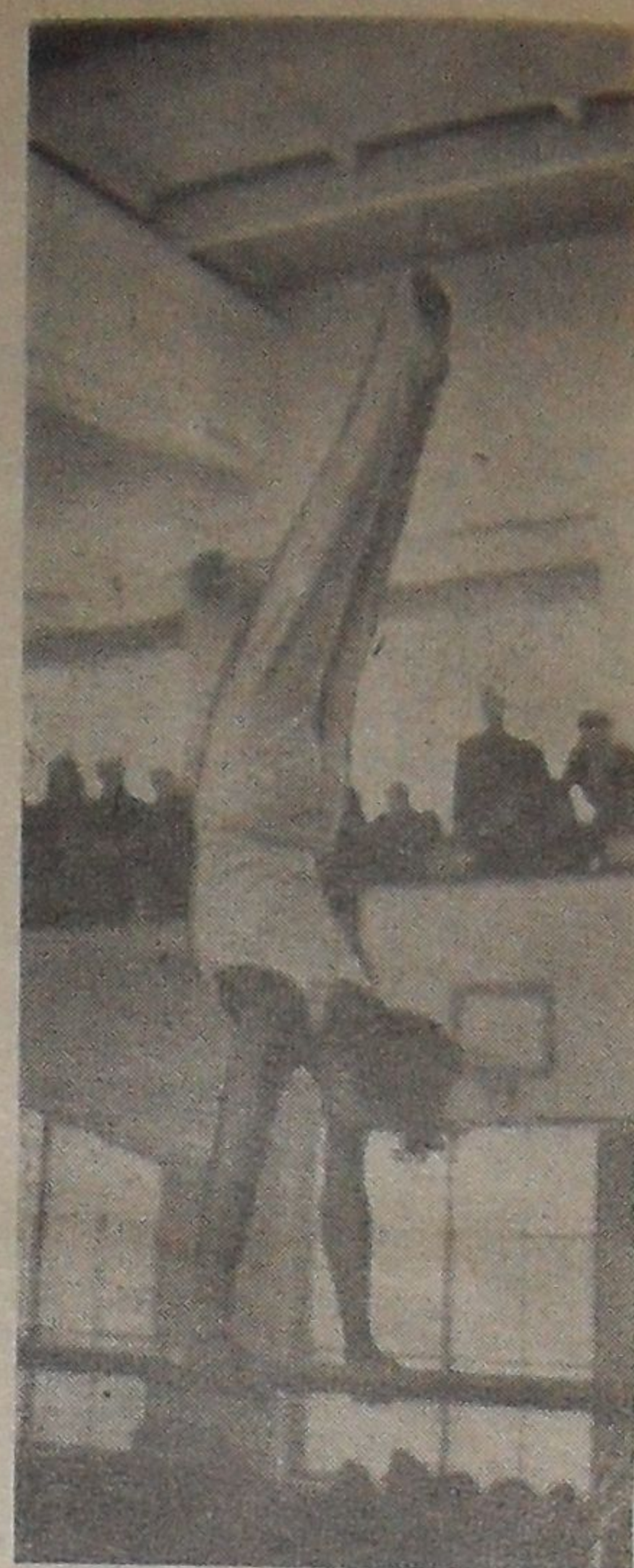
13-15 ноября в Дубне прошло первенство Центрального совета физической культуры и спорта по спортивной гимнастике. В этих соревнованиях успешно выступили гимнасты дубненской детской спортивной школы.