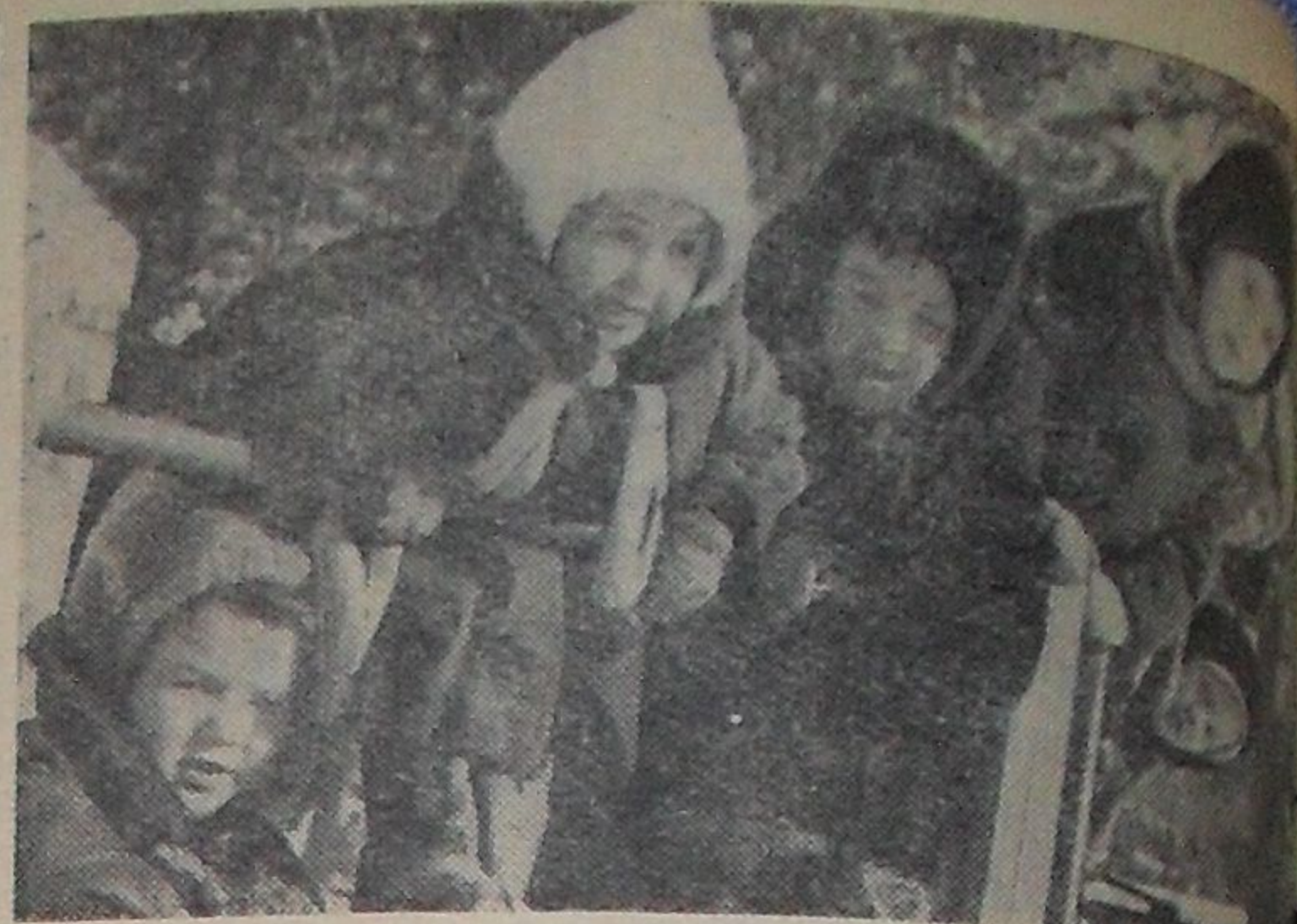
Ребята из комбината ясли-сад № 7.