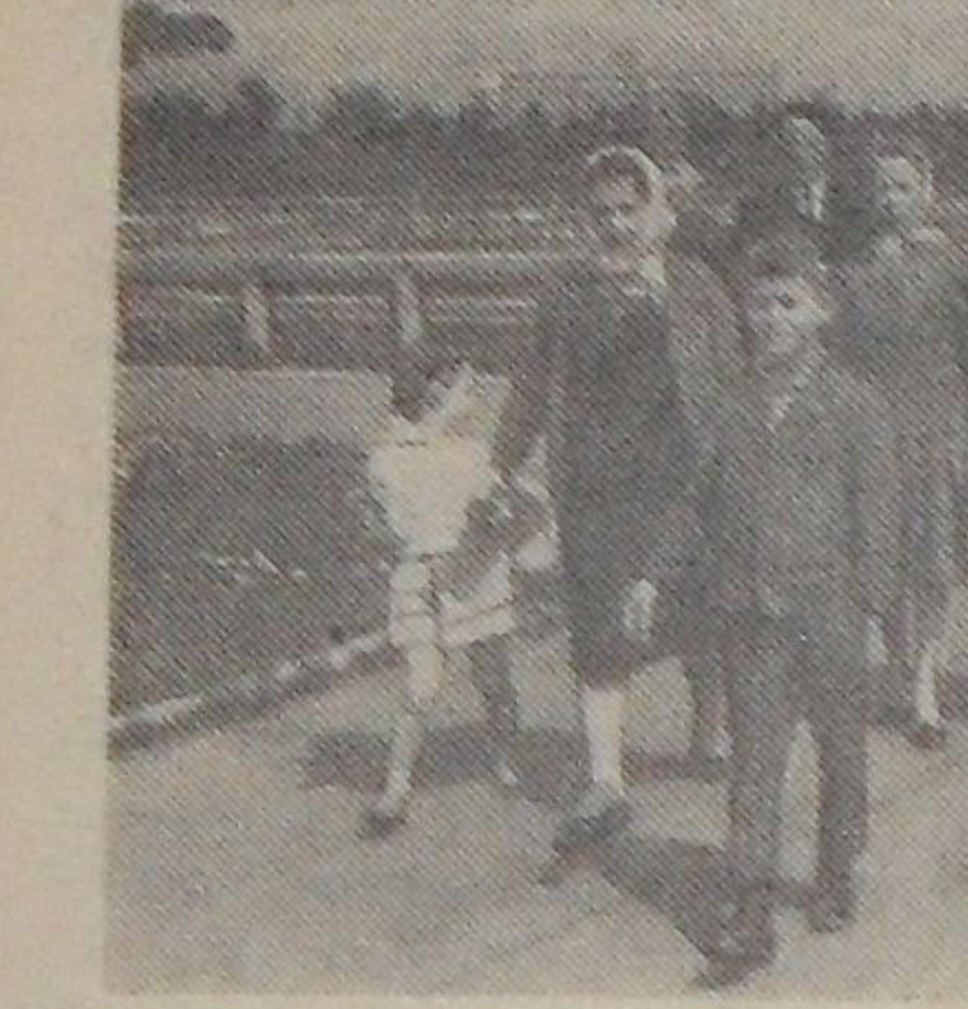
Строители умеют не только хорошо трудиться, но и интересно отдыхать. Постройком предприятия часто организует поездки в театры и музеи Москвы, экскурсии на передовые стройки.