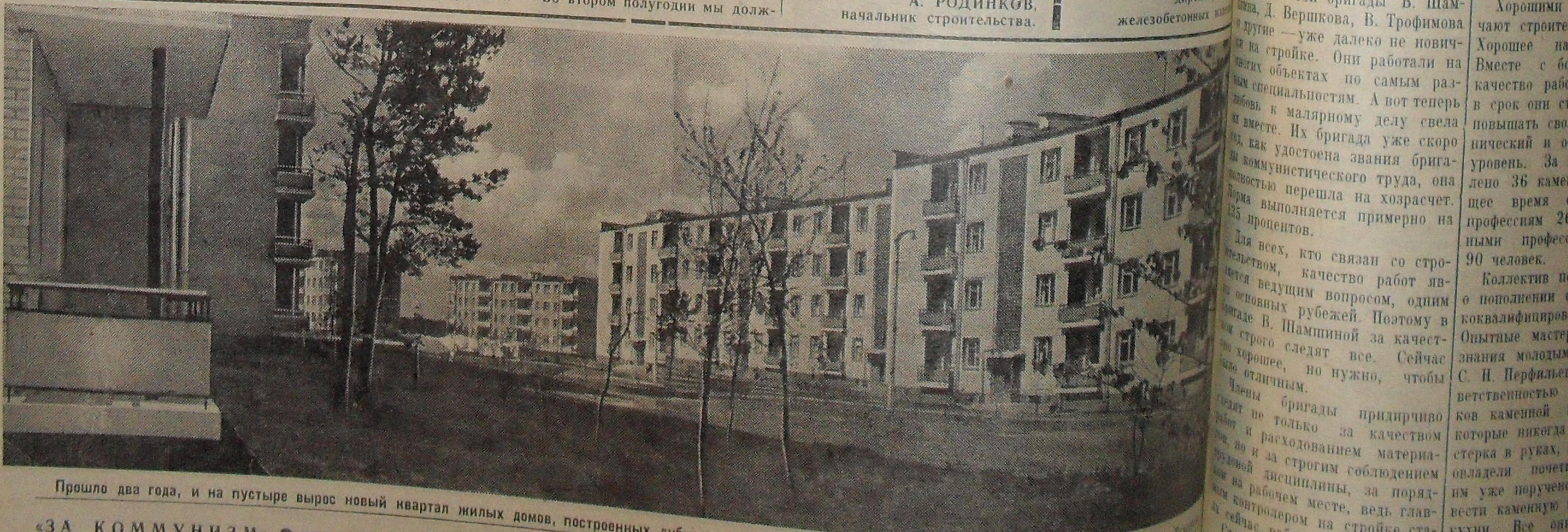
Прошло два года, и на пустыре вырос новый квартал жилых домов, построенных дубненскими строителями.