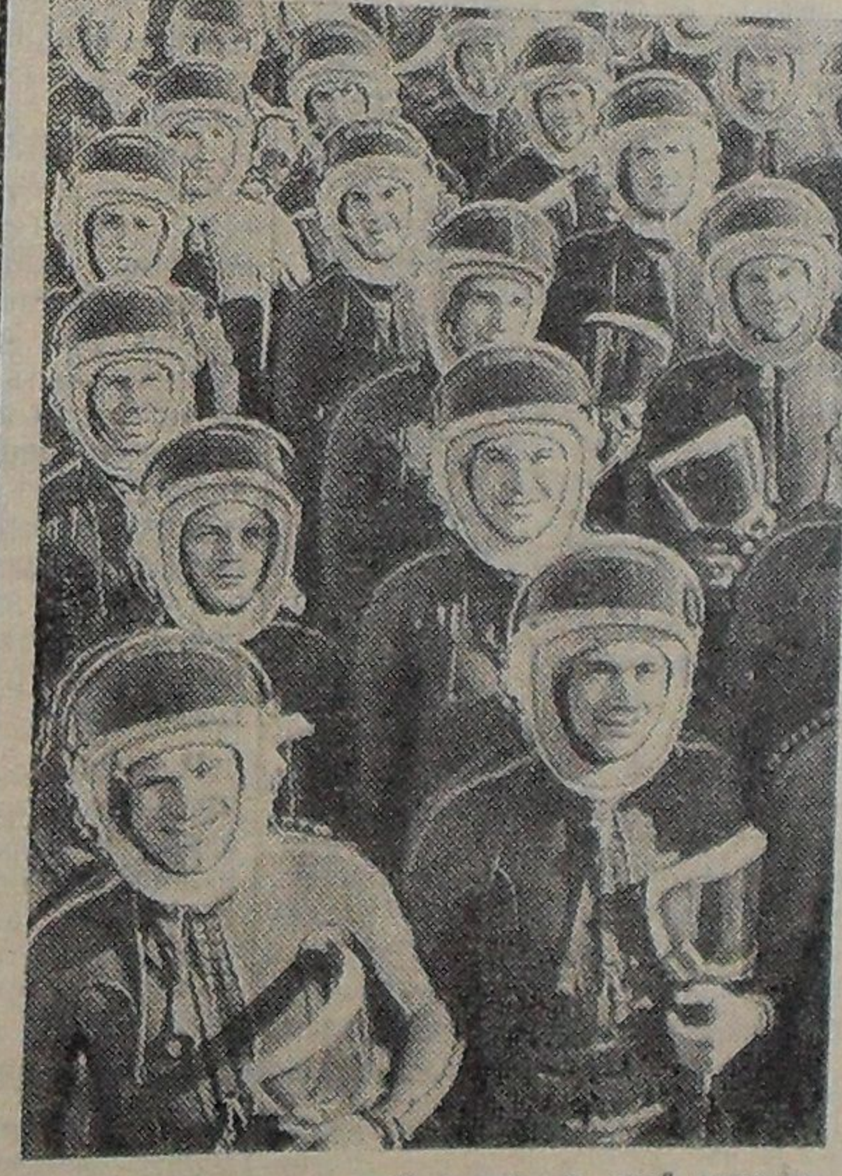
У каждого из них свой характер, свой воздушный «почерк».

На одном из приволжских холмов, утопающих в зелени, разбиты здания Качинского высшего военного авиационного училища летчиков. Свое название — Качинское — оно получило от реки Качи, в долине которой, под Севастополем, была основана в 1910 году первая в России авиационная школа. Теперь оно находится в Волгограде.