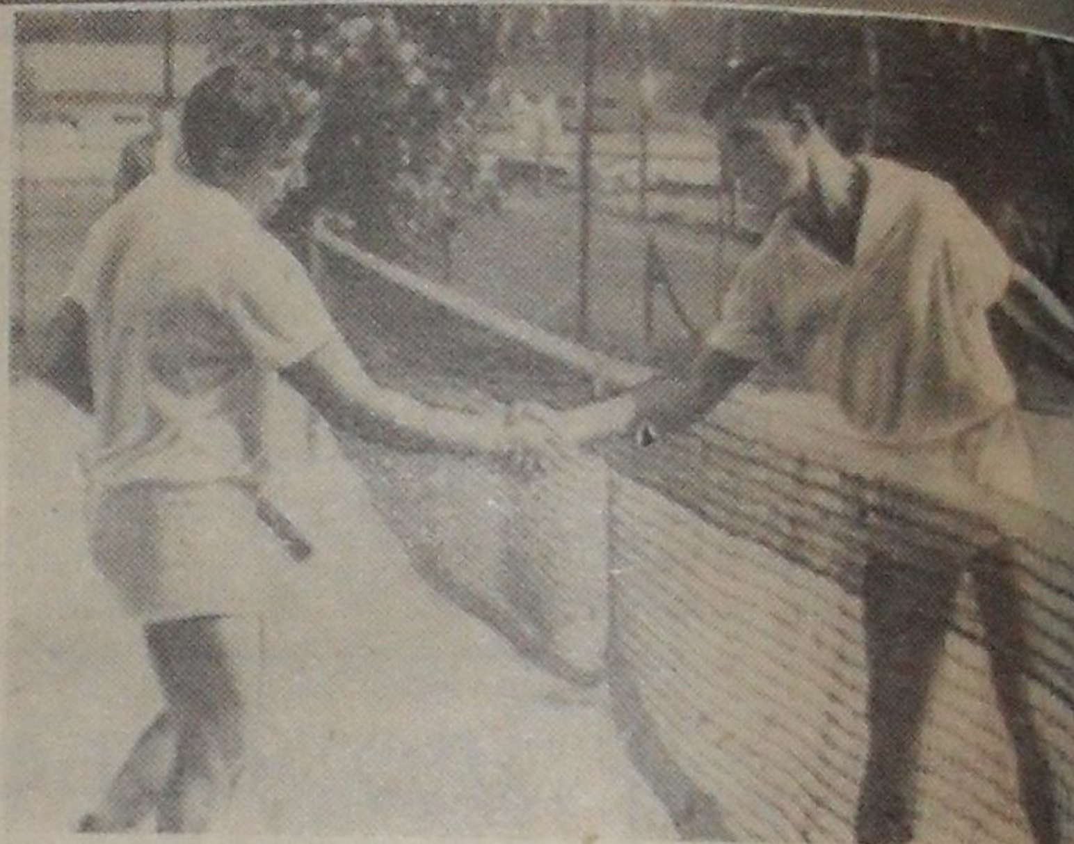
Рукопожатие чемпионов 1964—1965 гг.