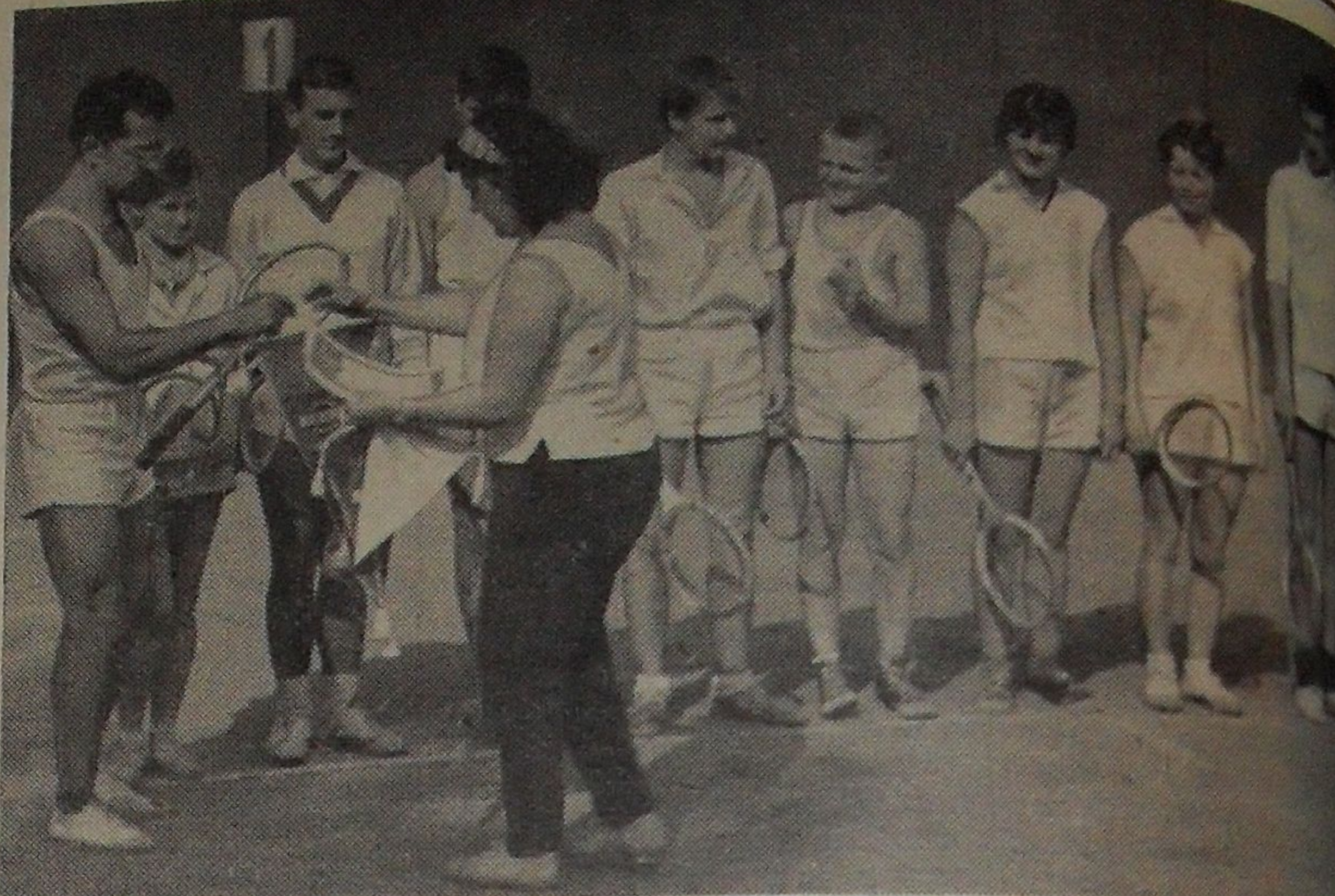
Теннисисты Дубны завоевали первое место по Мособлсовету ДСО «Труд» на 1965 год.

ПЯТНИЦА, 10 СЕНТЯБРЯ 12.00 — Телевизионные новости. 12.15 — Для учащихся второй смены.