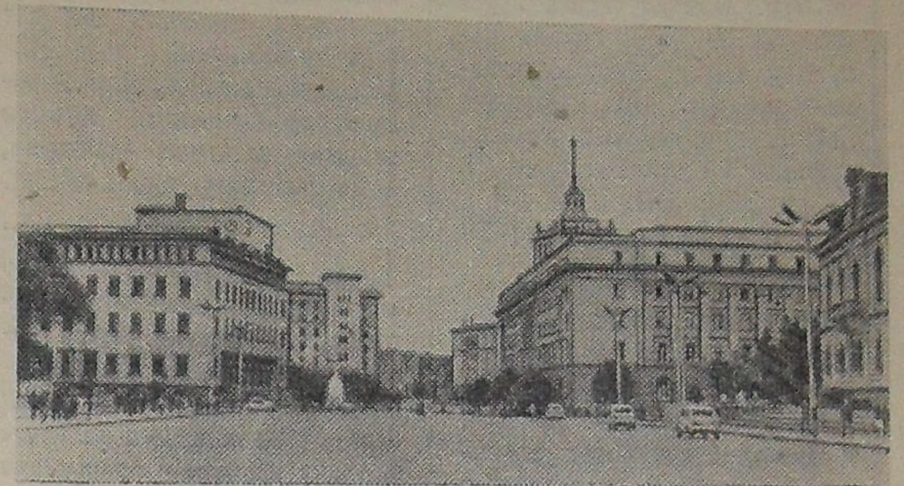
София. Площадь 9-го сентября.