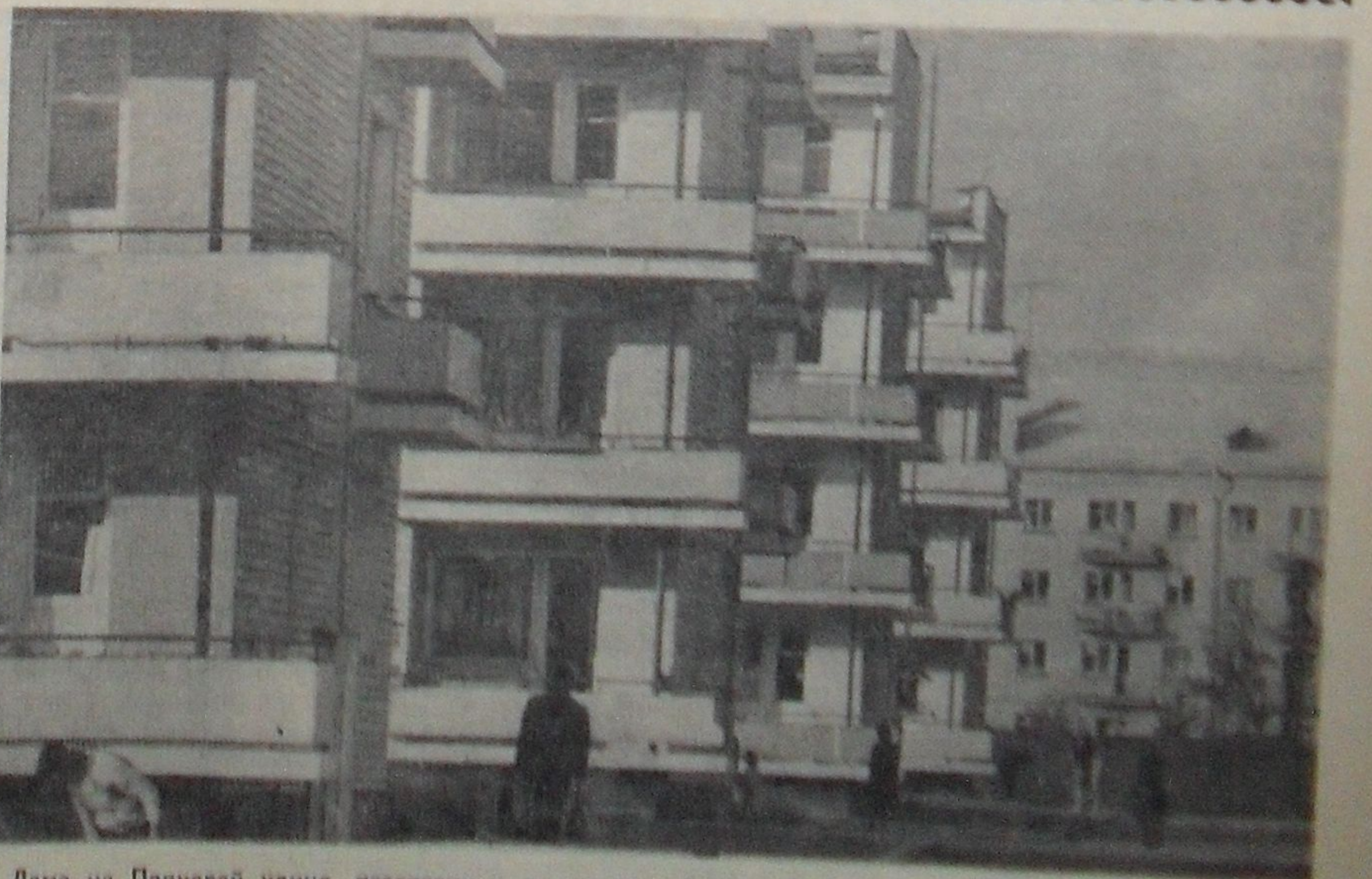
Дома на Парной улице, построенные по проекту болгарских архитекторов.