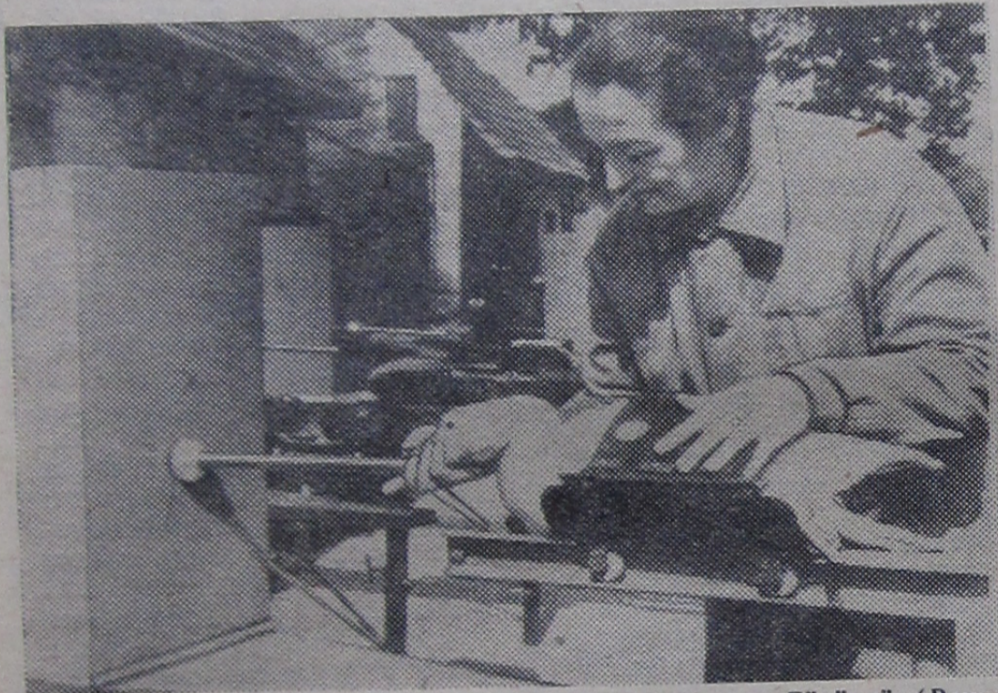
Специалисты сельскохозяйственного института в Гёделле (Венгрия) сконструировали приспособление для интенсивного массового откорма гусей. В Татабане начат серийный выпуск этих аппаратов. При кормлении новым методом гуси быстро набирают в весе, печень их бывает больше и вкуснее обычного.