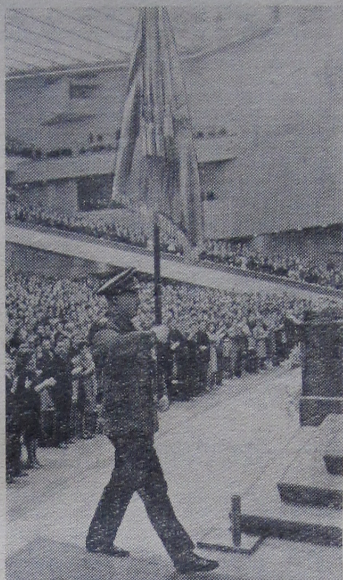
На снимке: летчик-космонавт А. Леонов выносит знамя Ленинского комсомола.

С 17 мая в Кремлевском Дворце съездов работает XV съезд комсомола.