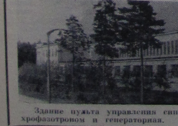
Здание пульт управления синхрофазотроном и генераторная.

ДВАДЦАТЬ ЛЕТ НАЗАД. На место заболоченной старой деревни на берегу Волги пришли строители, чтобы коренным образом изменить облик этих мест. Новым жителям Дубны трудно представить, что сравнительно недавно на месте нынешнего современного города были ветхие деревянные избышки, топкие болота и лес.