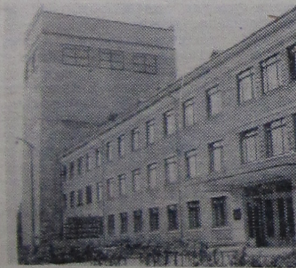
Лаборатория нейтронной физики.