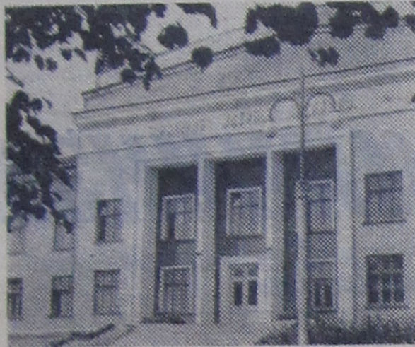
Лаборатория ядерных реакций.