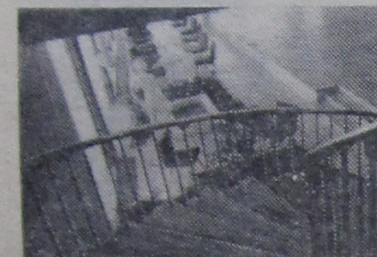
Вестибюль гостиницы «Дубна».

Честно говоря, все мы в душе уж если не архитекторы или строители, то во всяком случае знатоки. Проходи по своему городу, по его молодым зеленым улицам, мы часто ловим себя на том, что оцениваем плоды строительного труда. Нам нравятся одни дома, их современное и удачное функциональное решение, сочетание красивого с полезным. Вот в этих квартирах нам хотелось бы жить, а другие мы сурово критикуем.