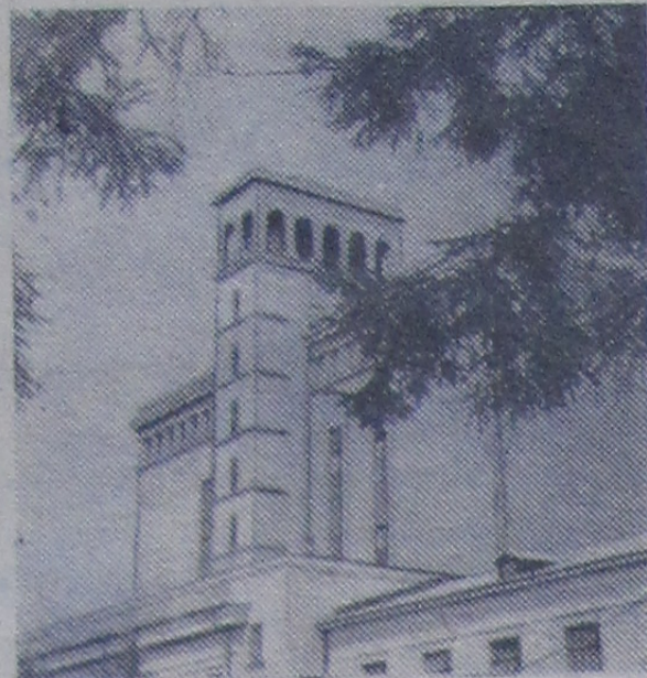
Здание самого первого ускорителя синхротрона Лаборатории ядерных проблем.