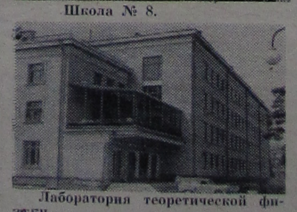
Лаборатория теоретической физики.