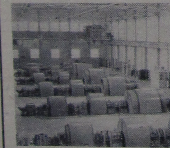
Генераторный зал синхрофазотрона.