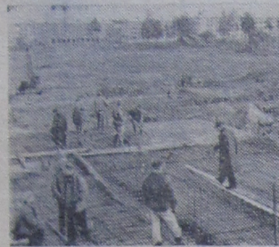
Таким пустынным был 19-й квартал в 1962 году.