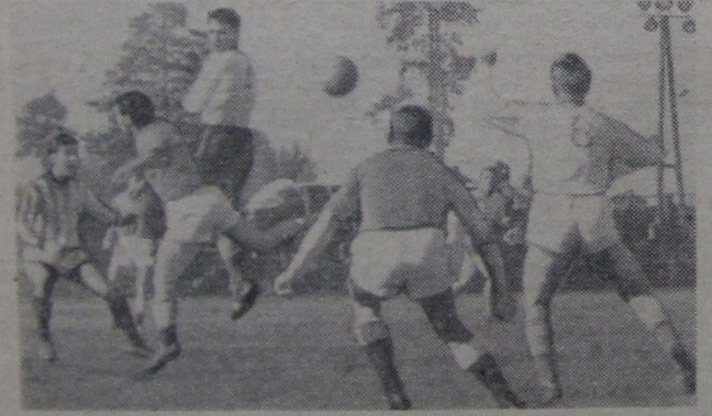
На снимке: момент острой атаки дубненцев.

В зоне лидируют юноши Дубны, на третьем месте — наша команда взрослых.