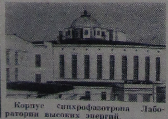
Корпус синхрофазотрона Лаборатории высоких энергий.