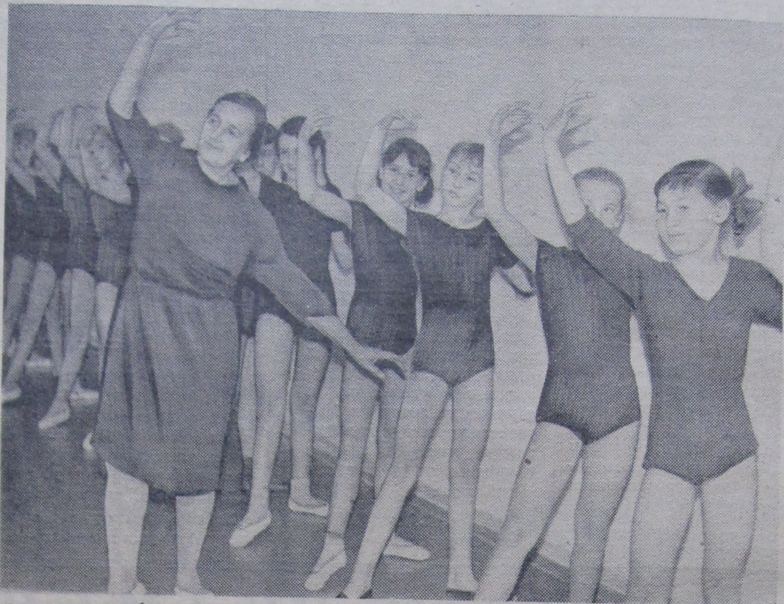
тело становится более послушным, движения точными и легкими. И прямо на глазах совершается чудо: гадкий утенок превращается в прекрасного лебедя.

Идут занятия в студии. Четкие, постоянные, напряженные. И постепенно правильной становится асанка, приобретает опыт,