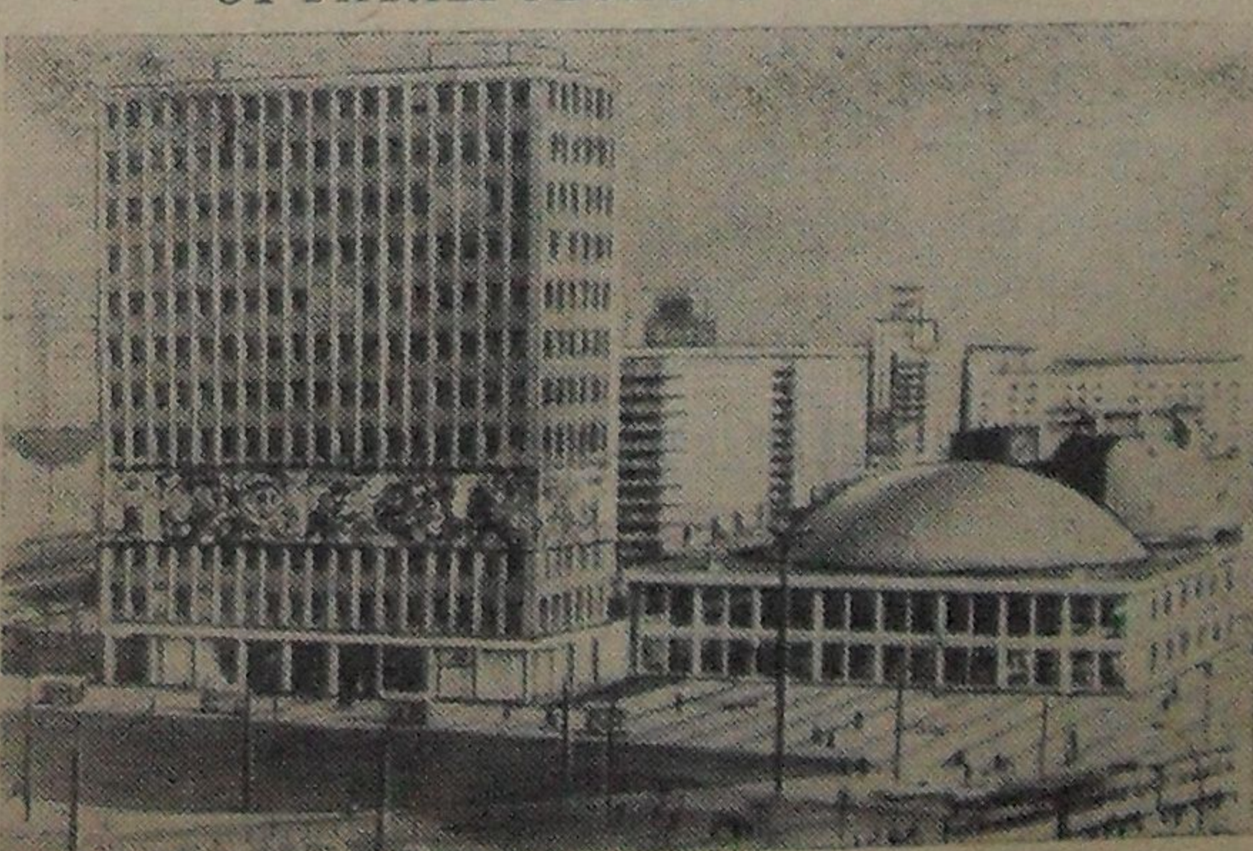
Берлин — столица Германской Демократической Республики. Прекрасные здания современного архитектурного стиля украшают центральную площадь Александерплац.