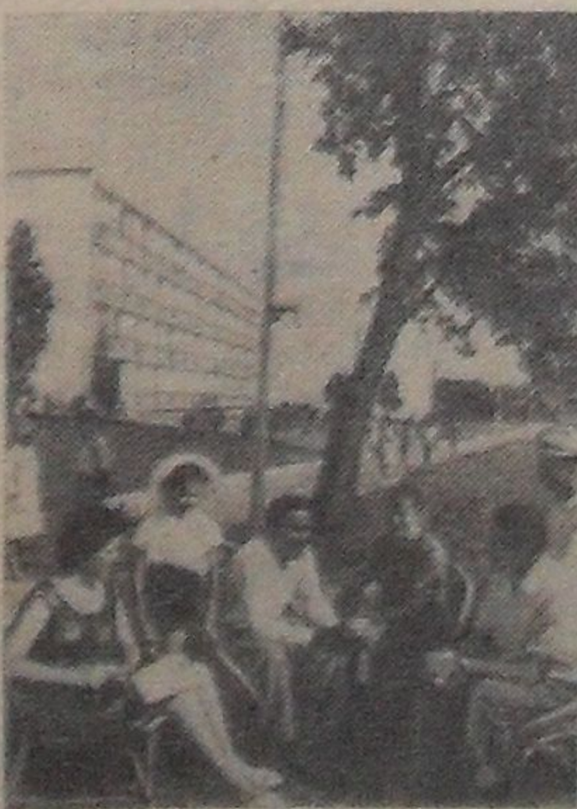
Всесоюзный курорт Сочи пополнился еще одной здравницей. На площадке между поселком Ку-

депта и Адлером вступил в строй пансионат «Адлер». В него входят 7 спальных корпусов с благоустроенными палатами на 2—3 человека, ресторан-столовая на 1.050 мест, широкоэкранный кинотеатр... Все это первая очередь Адлерского курортного городка.