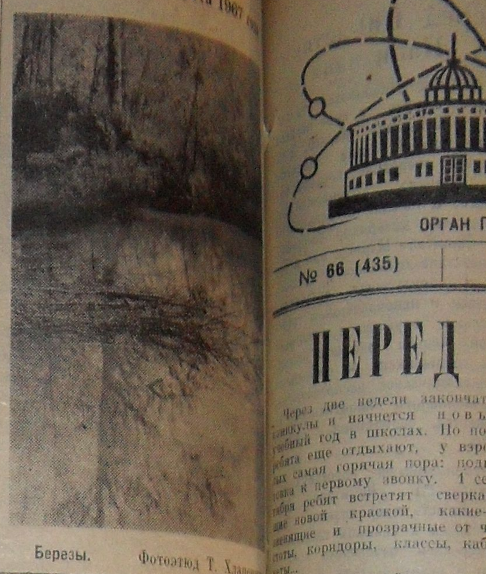
Березы.