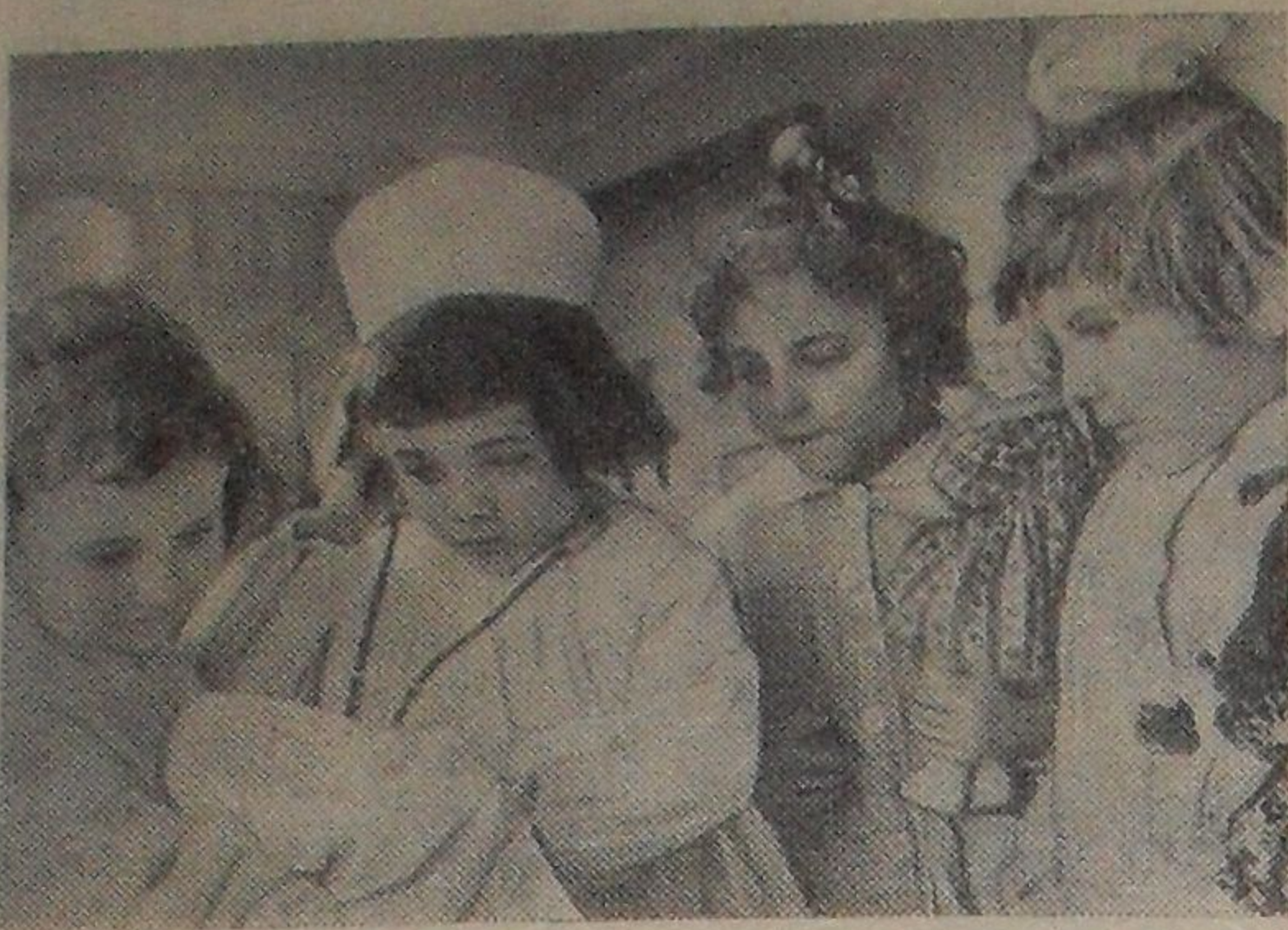
В Болгарии исключительное внимание уделяется дошкольному воспитанию. В стране насчитывается около 8.000 детских садов.

Участники семинара ознакомились с краеведческим музеем, комнатой Боевой славы средней школы № 8. Экскурсоводы — пионеры и комсомольцы познакомили участников семинара с экспонатами и документами, рассказали о своих походах на Брянщину и о собранных материалах.