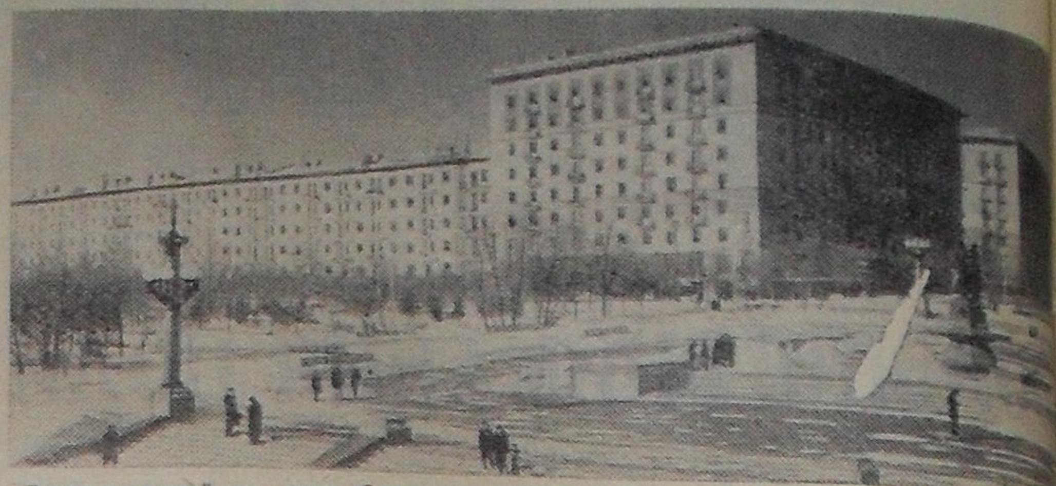
Возрожденный из руин — Сталинград (ныне Волгоград). Жилые дома на Мамаевом кургане. Фотохроника ТАСС

Величественный монумент, воздвигнутый в память героев Сталинградской битвы на Мамаевом кургане, расскажет грядущим поколениям о беспримерном подвиге советского народа.