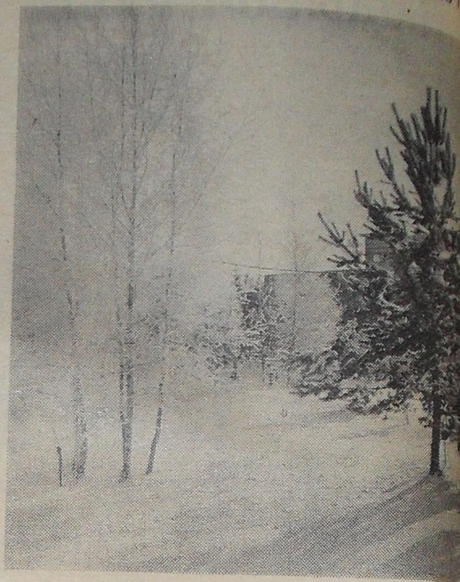
В зимнем наряде