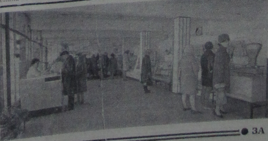
● ЗА КОММУНИЗМ