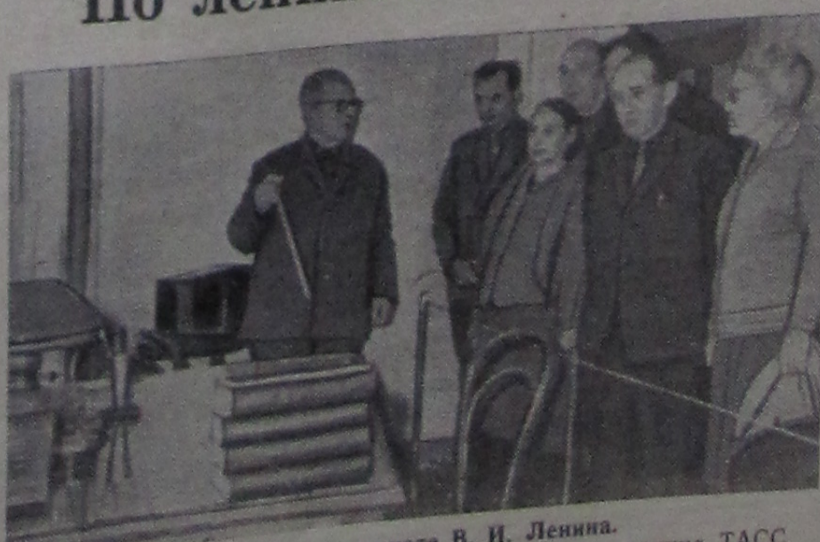
На снимке: экскурсанты в комнате В. И. Ленина.

В 1967 году по инициативе старых коммунистов Ждановского района здесь был открыт Музей революционных, боевых и трудовых традиций Ждановского района.