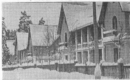
Коттеджи в районе Черной речки