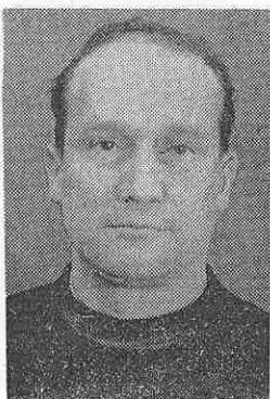
Вспоминаю о тех, кто в пятидесятых годах одним из первых стал проводить эксперименты на ускорителе ЛЯП АН СССР (ныне ЛЯП ОИЯИ) и

Принять социалистические обязательства коллектива Института на 1970 год. Актив выступает с призывом к лабораториям и другим подразделениям Института, а также к общественным организациям национальных групп сотрудников ОИЯИ включиться в работу по успешному выполнению принятых обязательств.