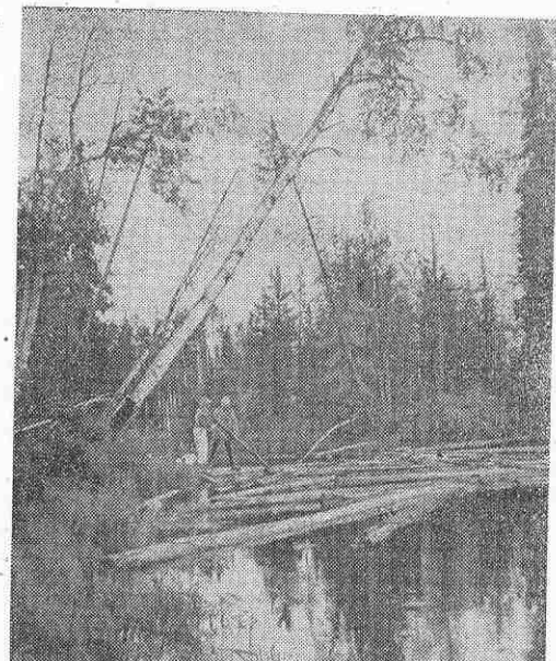
Во многих уголках Советского Союза побывали дубнеченцы. На снимке: сотрудники Лаборатории нейтронной физики в одном из походов.