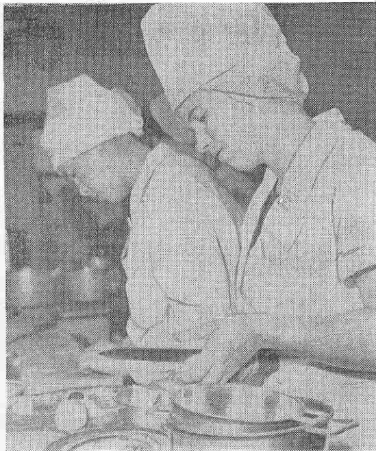
В мире науки и техники