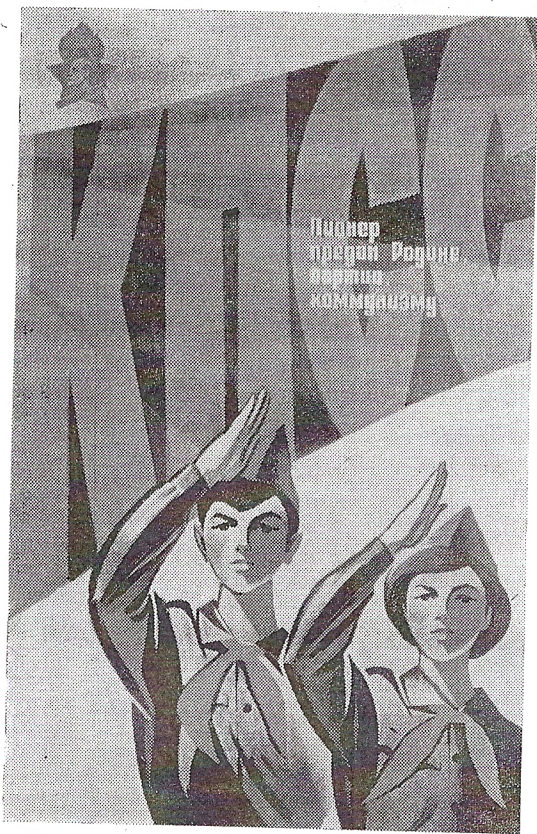
Плакаты художника В. Сачкова (издательство «Изобразительное искусство»).