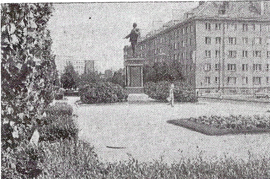
Столица Эстонской ССР — Таллин. Памятник В. И. Ленину.

Первый комбинат с пастбищем в 700 гектаров был создан при